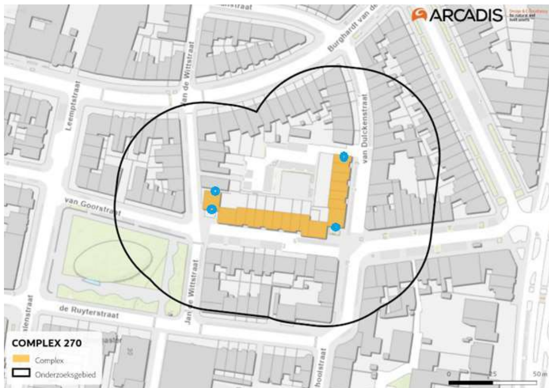
Figuur 3: Locaties permanente voorzieningen (Arcadis, 2022).