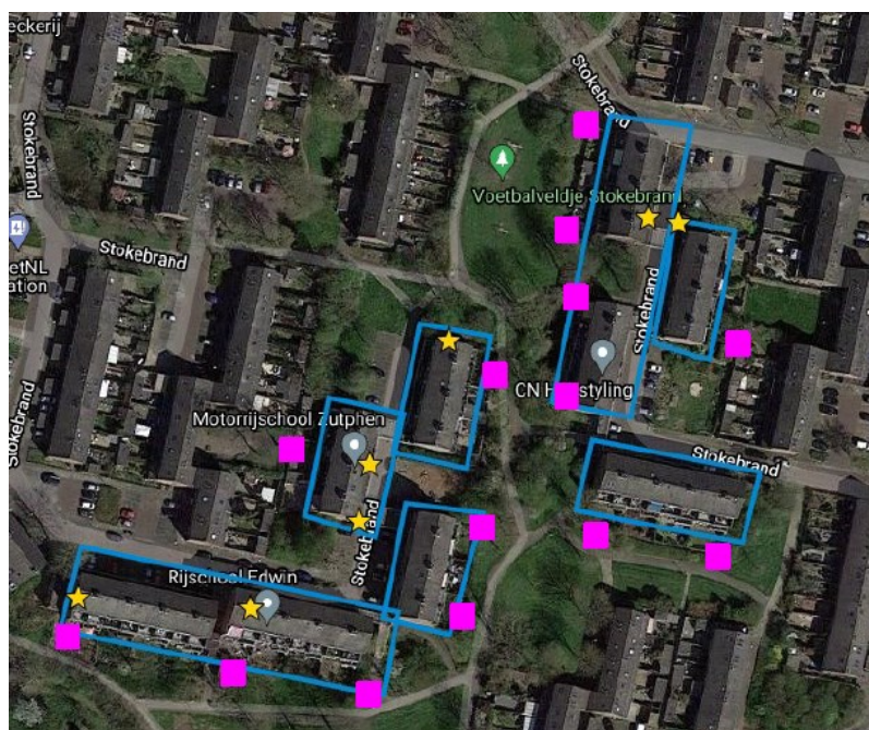
Figuur 1: Locatie 14 paaltopkasten T3 voor de gewone dwergvleermuis (paarse rechthoeken)