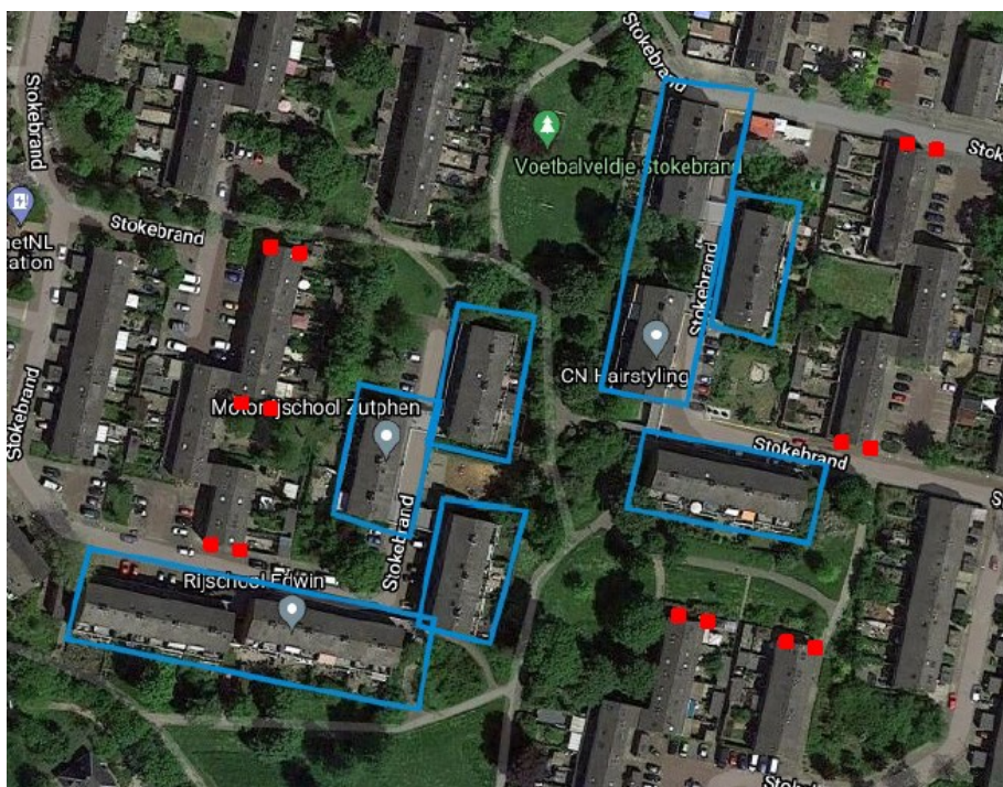
Figuur 4: Locaties 14 aangebrachte tijdelijke vleermuiskasten.