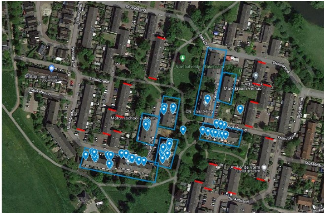
Figuur 3: Locaties huismusnesten (blauw) en 120 tijdelijke nestkasten (in rood =6 per kopgevel).