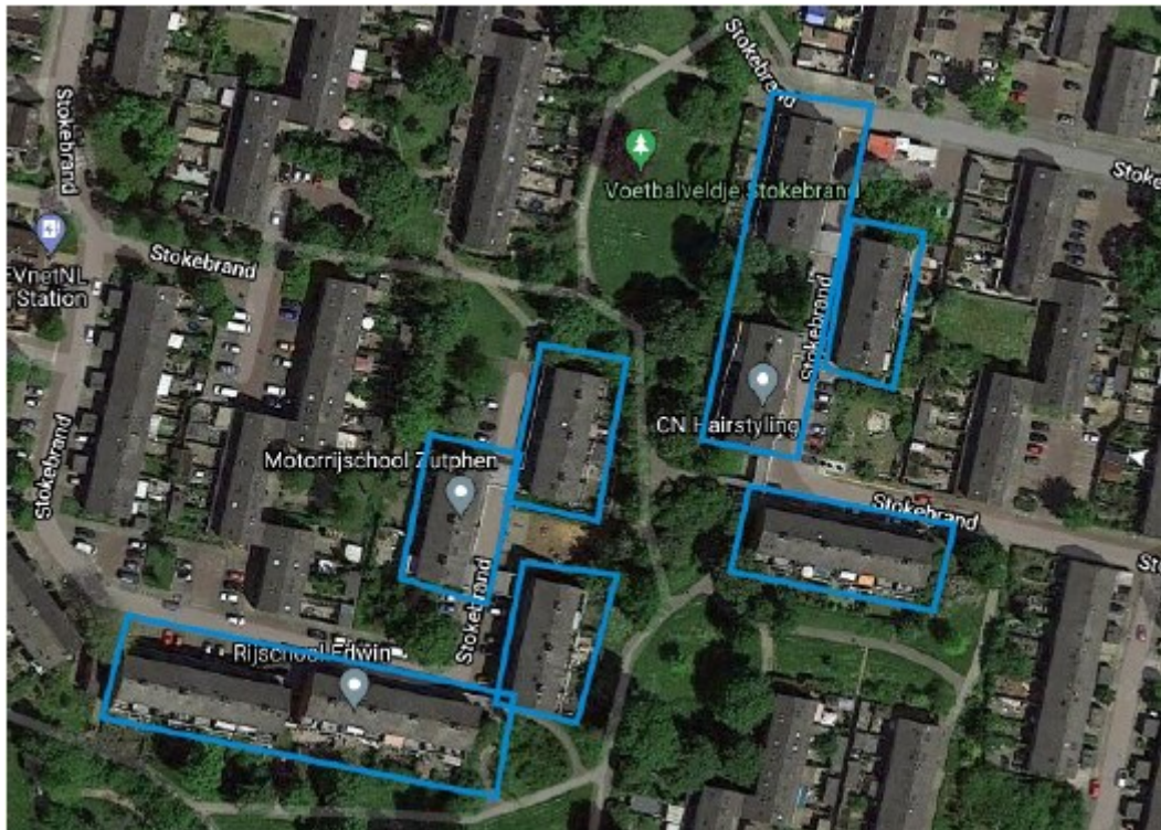
Figuur 1: Plangebied complex 314 aan de Stokebrand 41-131 (oneven) en 286-408 (even) te Zutphen (blauw omlijnd).