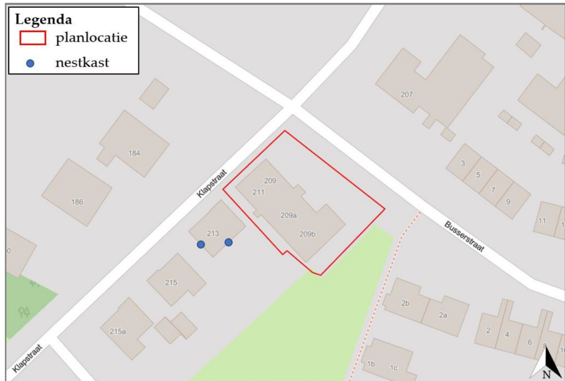
Figuur 2. Locaties tijdelijke nestkasten (blauwe stip) ten opzichte van het plangebied (rode kader).