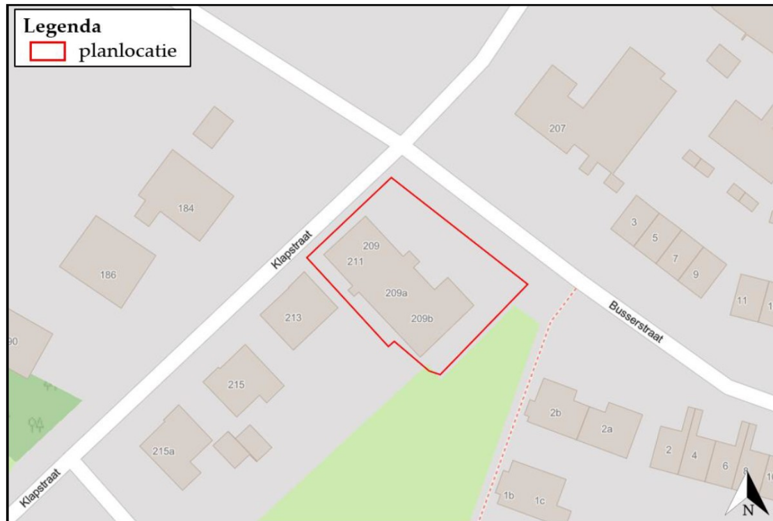
Figuur 1. Ligging en begrenzing plangebied aan de Klapstraat 209 – 211 te Westervoort.