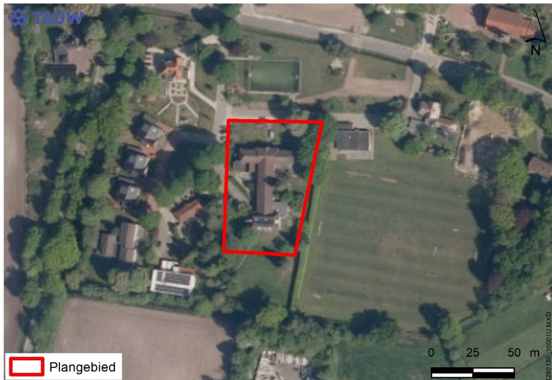
Figuur 2. Luchtfoto projectgebied