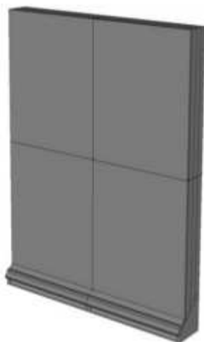
Figuur 3. Dubbel geschakelde kasten van het type 'Standaard inbouwkast 1' van Tichelaar