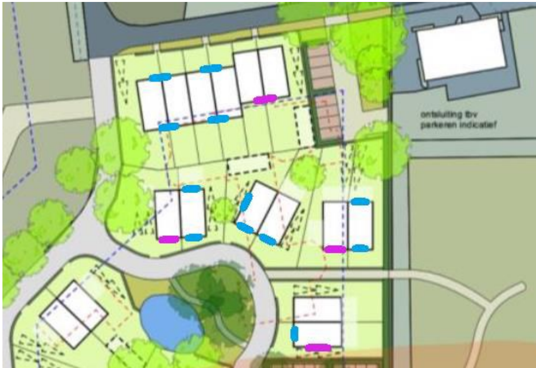
Figuur 2. Locaties permanente vleermuiskasten (blauw=paarverblijven, roze=kraamverblijven)