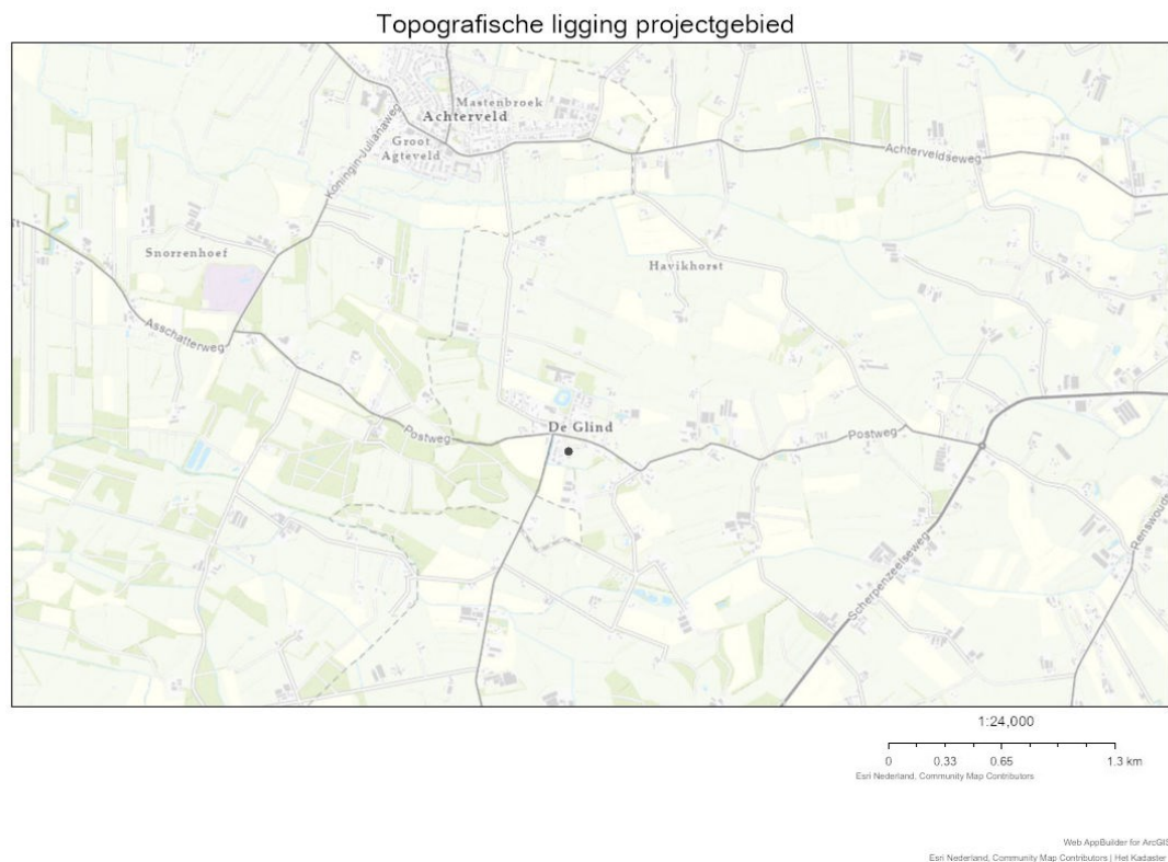
Figuur 1. Topografische ligging projectgebied