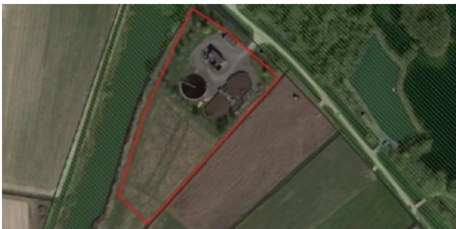
Figuur 2. Luchtfoto plangebied.