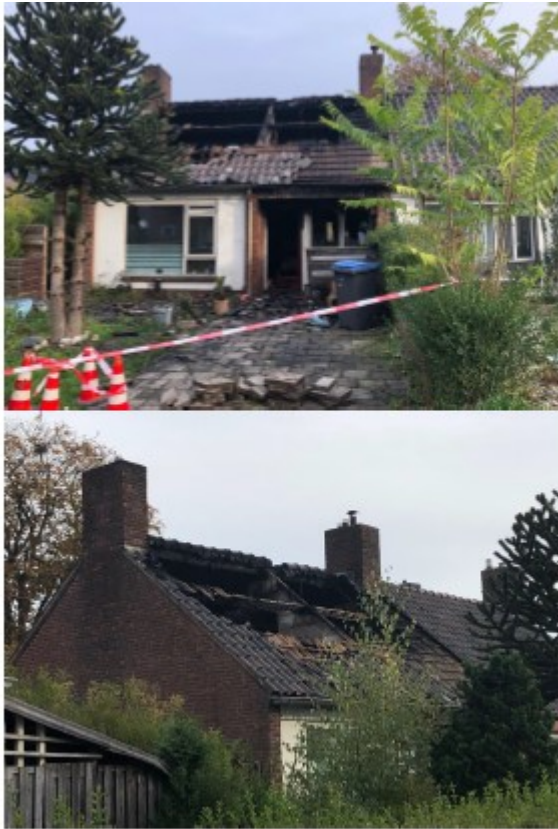
Figuur 3. Foto's brandschade.