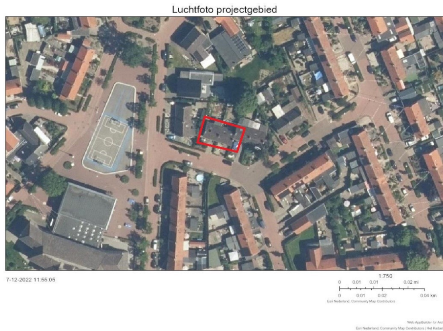
Figuur 2. Luchtfoto projectgebied.