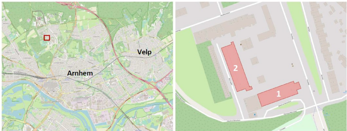
Figuur 1. Globale ligging plangebied (links) en de te renoveren flats (recht) aan het Omerusplein 1 t/m 55 (flat 1) en Omerusplein 56 t/m 83 (flat 2).