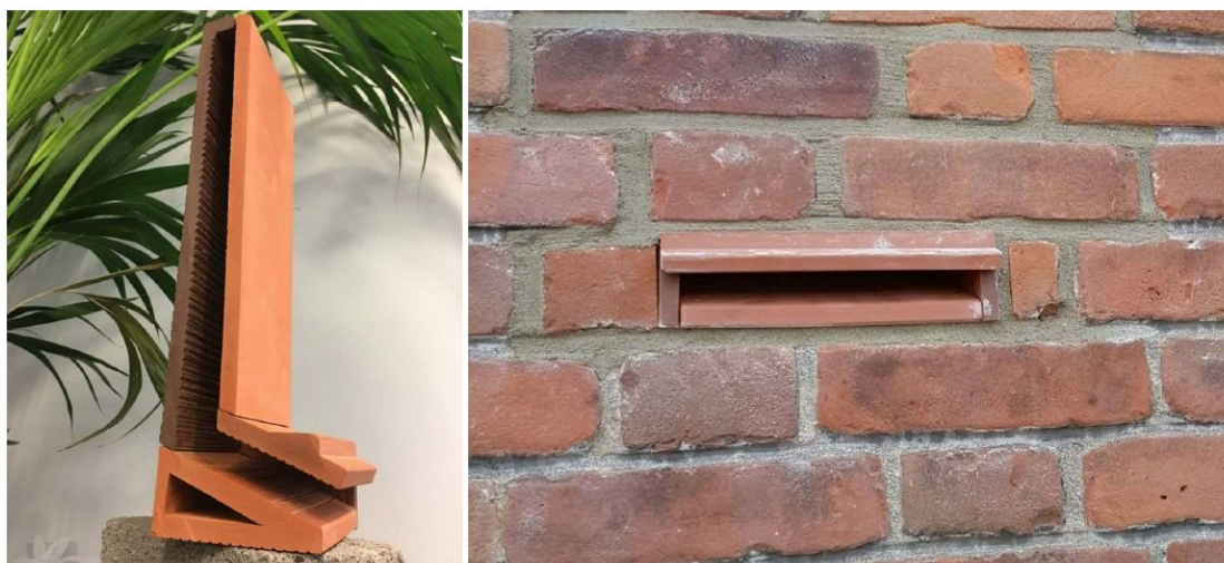
Figuur 3. Permanente vleermuiskasten (10 stuks) als zomer- en paarverblijfplaats. Merk Tichelaar, type 'klein' of vergelijkbaar.