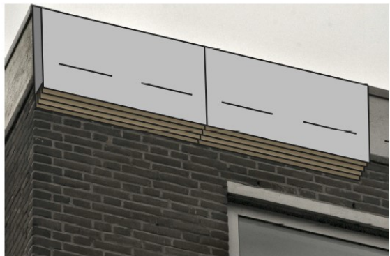
Figuur 5. Grote externe kast (3 stuks) aan de voor vleermuizen ongeschikte dakrand. Merk Vivara, type 'VK SK 03' of vergelijkbaar.