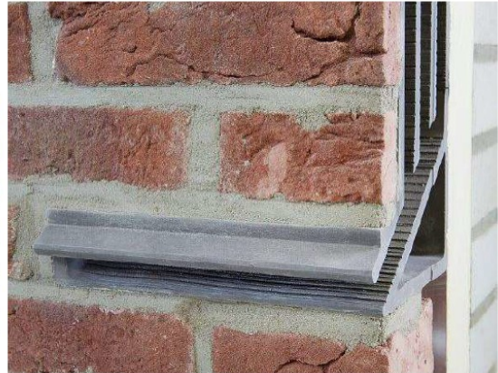
Figuur 4. Permanente vleermuiskast (3 x 4 stuks) als kraamverblijfplaats. Merk Tichelaar, type 'groot' of vergelijkbaar.