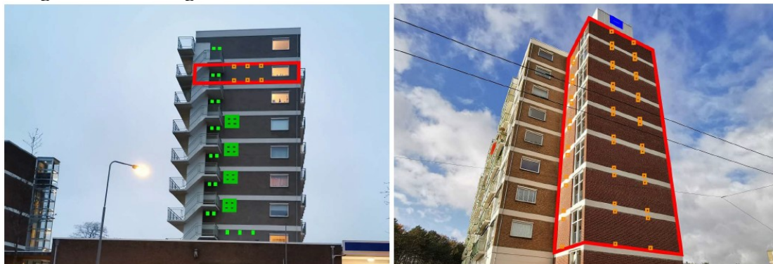
Figuur 6. Mitigerende maatregelen op de kopgevels van flat 1: