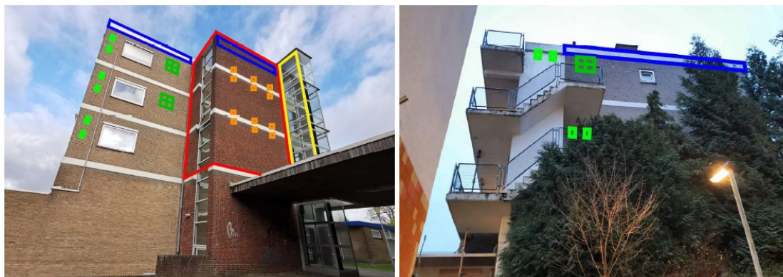
Figuur 2. Mitigerende maatregelen op de kopgevels van flat 2: