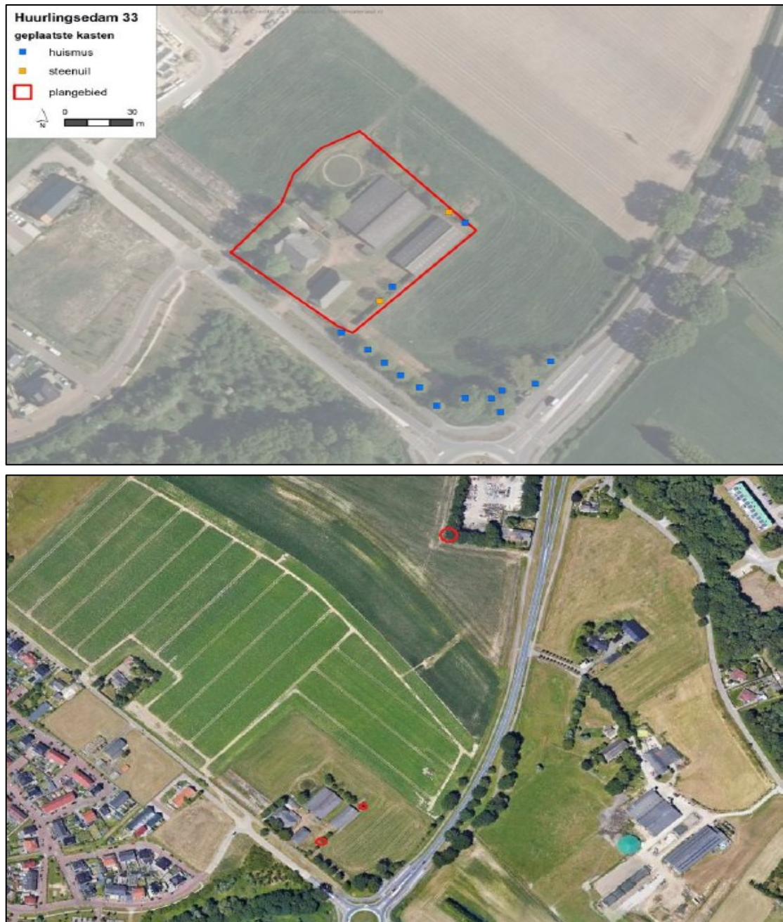
Figuur 2. De locaties van de tijdelijke huismuskasten van het type NK MU 04 van Vivara Pro (blauwe stippen) en de permanente steenuilenkasten van het type UK ST 01 van Vivara Pro (oranje stippen), afbeelding boven. Op de onderste afbeelding is de locatie van de derde steenuilenkast (rode cirkel) ten noorden van het plangebied weergegeven, inclusief de locaties van de twee kasten binnen het plangebied.