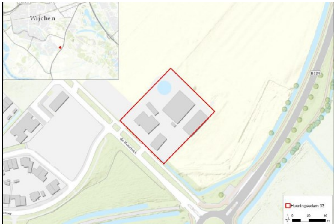
Figuur 1. Ligging en begrenzing (rood omlijnd) van het plangebied aan de Huurlingsedam 33 te Wijchen. De grijze vlakken weergeven de bebouwing, de blauwe cirkel het te verwijderen waterreservoir.