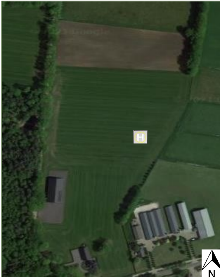
Figuur 2: Ligging van de helihaven (met teken H) ten noorden van Wesselseweg 23 te Barneveld.