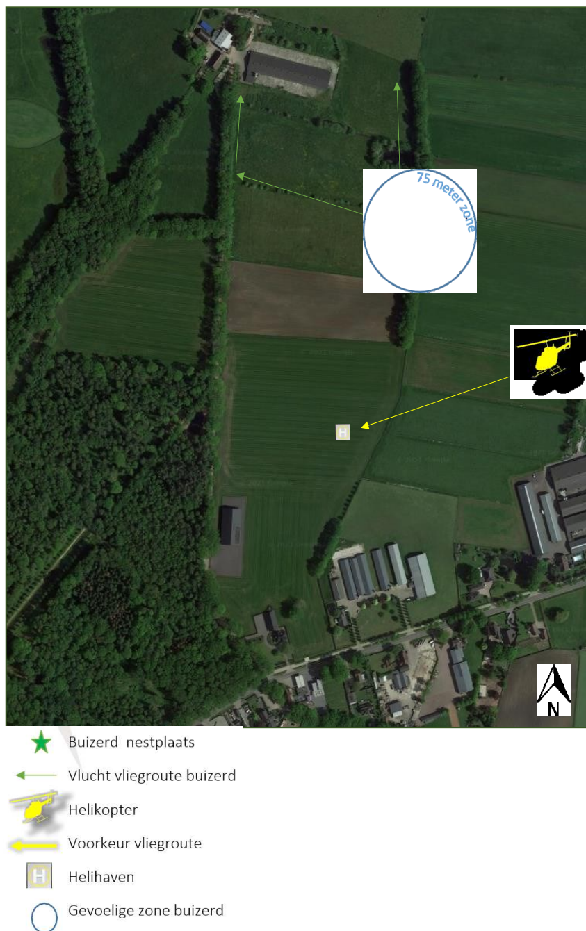
Figuur 5: Overzicht van een tweetal mitigerende maatregelen: vliegrichting helikopter bij landing en betredingsvrije zone rond het buizerdnest.