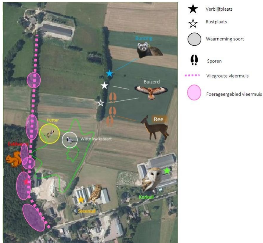
Figuur 4: Overzichtskaart plangebied met daarop aangetroffen beschermde soorten.