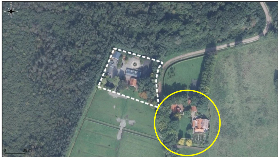
Figuur 2. Zoekgebied alternatieve nestlocaties huismus aan de Meekertweg 14 (gele cirkel) ten opzichte van het projectgebied (witte stippellijn).