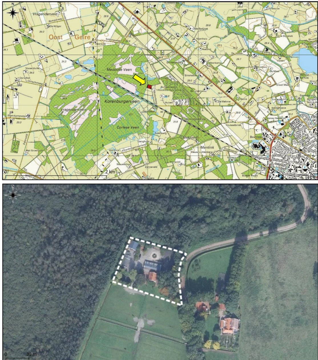
Figuur 1. Ligging (bovenste kaart) en begrenzing projectlocatie (onder) aan de Meekertweg 7 te Winterswijk.