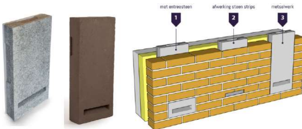
Voorbeelden van inbouwkasten ter mitigatie van zomer- en paarverblijfplaatsen. De grijze kast betreft de VMPM1 – Inbouwkast van Faunaprojecten, de bruine kast betreft de IB VL 05 Inbouwsteen Vleermuizen van VivaraPro en recht een illustratie van hoe de kasten kunnen worden ingebouwd in de gevels.