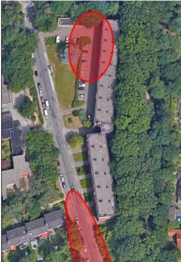
Figuur 2: Overzicht van waargenomen paarverblijfsplaatsen van gewone dwergvleermuis in het appartementencomplex aan de Kluizeweg 102 e.v. te Arnhem.