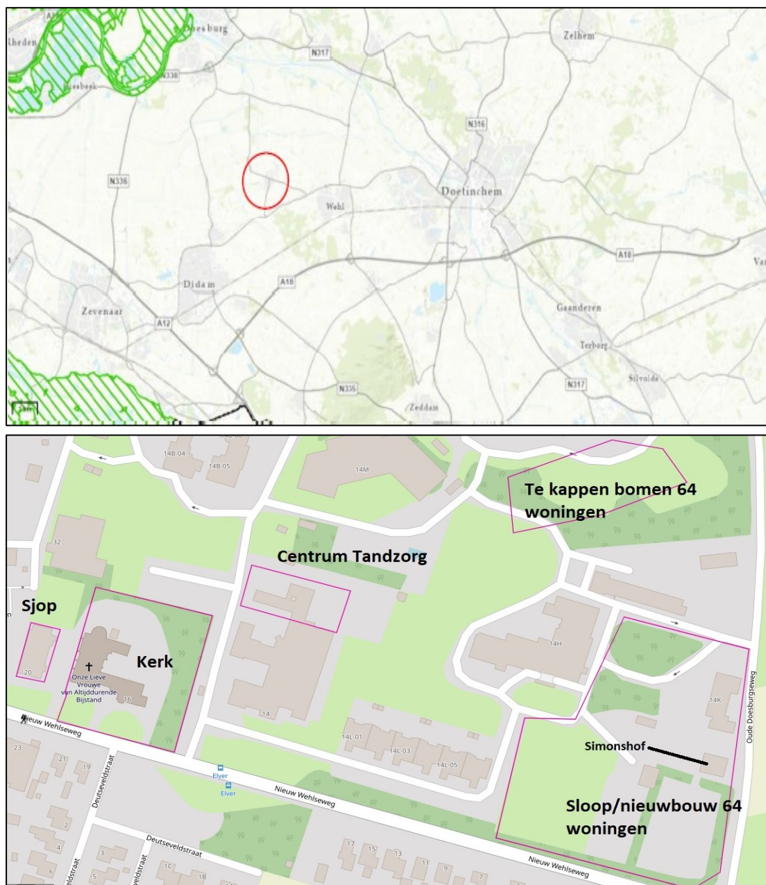
Figuur 1. De ligging en begrenzing van het plangebied aan de Nieuw Wehlseweg 14 te Wehl. Op de onderste afbeelding zijn de gebieden met de geplande ingrepen op zorglocatie Elver roze omlijnd. Van links naar rechts: (1) dakrenovatie gebouw 'De Sjop', (2) verbouwing van een deel van de Kerk, (3) sloop en uitbouw van de achterzijde van hoofdgebouw 'Centrum Tandzorg' en (4) en (5) de kap van enkele bomen en de sloop van enkele gebouwen ten behoeve van nieuwbouw van 64 cliëntenwoningen.