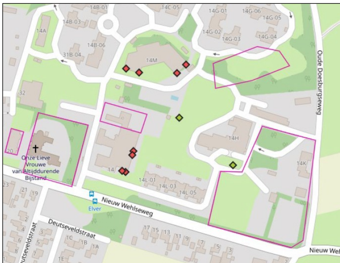
Figuur 2. De locaties van 8 tijdelijke vleermuiskasten van het type VK WS 02 van Vivara Pro (rode ruiten). Ter compensatie van de vier aangetroffen verblijfplaatsen van gewone dwergvleermuis worden aanvullend, in het voorjaar van 2022, nog 8 aanvullende vleermuiskasten van het type VK WS 02 van Vivara Pro (of soortgelijk) geplaatst. De locaties, en de datum van plaatsing, van de nog te plaatsen kasten worden zodra deze bekend zijn, maar uiterlijk 8 weken voorafgaand aan het ongeschikt maken en de werkzaamheden, aan de provincie Gelderland gestuurd onder vermelding van het zaaknummer 2021-