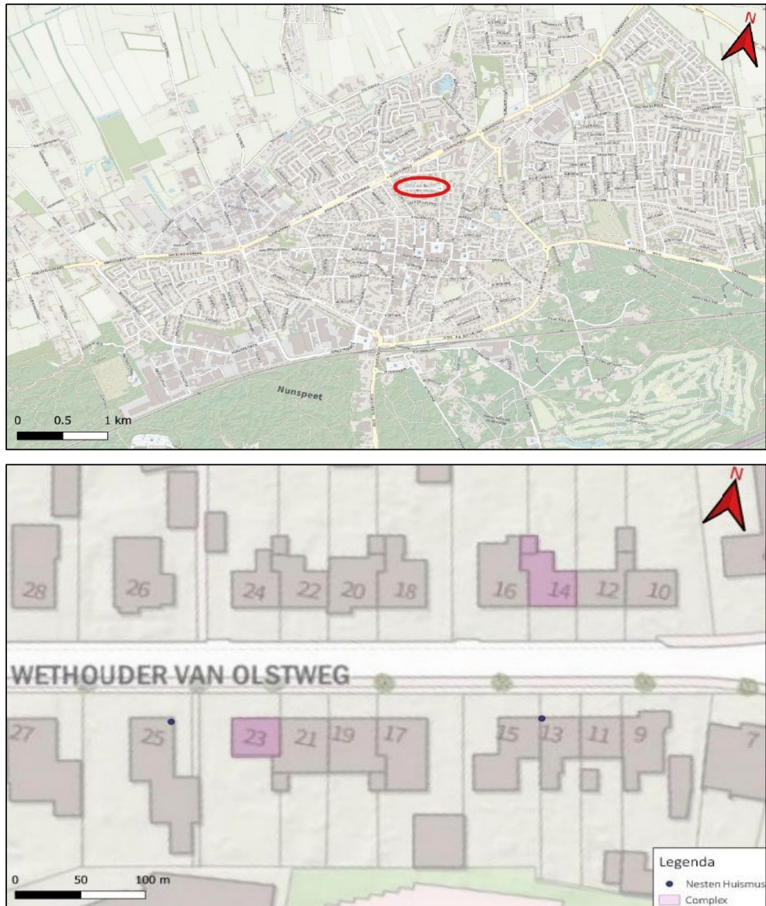
Figuur 1. Ligging van het plangebied aan de Wethouder van Olstweg 14 en 23 te Nunspeet. Op de onderste afbeelding zijn de twee te renoveren woningen paars gearceerd, terwijl de aangetroffen nesten van huismus (buiten het plangebied) met blauwe stippen weergegeven zijn.