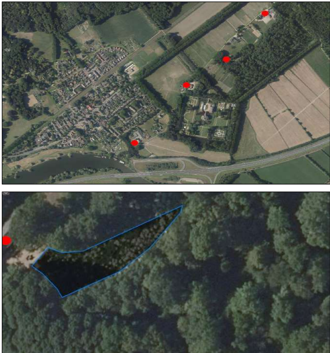
Figuur 2. De locaties van de permanente alternatieve voorzieningen in de vorm van kerkuilkasten (conform richtlijnen kennisdocument kerkuil, BIJ12, 2017) in de nabije omgeving (rode stippen). Op de onderste afbeelding is het te creëren alternatieve foerageergebied ter grootte van 927 m 2 weergegeven bij de 3 e rode stip van onderen gezien.