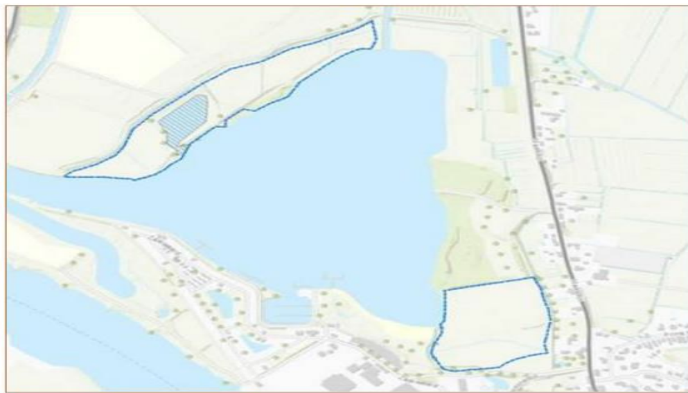
Figuur 2 Het plangebied bestaat uit de 2 blauw omlinjnde gebieden die liggen binnen het natuur- en recreatiegebied De Neswaarden, gemeente Aalst