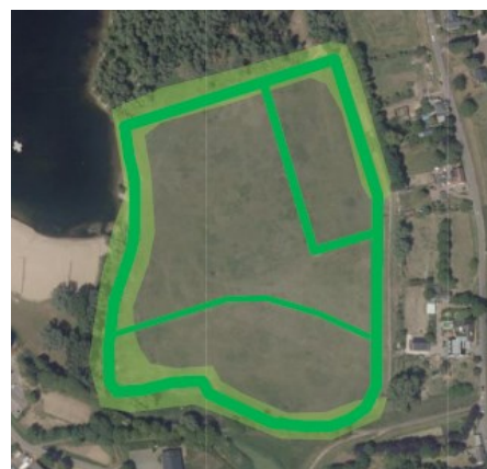
Figuur 4 Geschikt foerageergebied/migratieroutes voor kleine marterachtigen (groen)