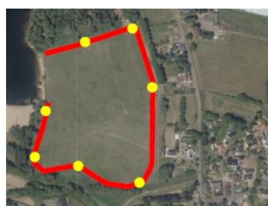
Figuur 5 Geschikte locaties (geel) en zoekgebied (rood) voor alternatieve verblijfplaatsen