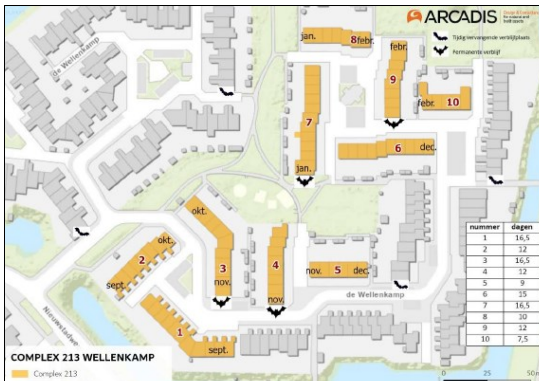
Figuur 2. De locaties van de tijdelijke en permanente voorzieningen van respectievelijk de types VMT1 van Unitura (of soortgelijk) en VMPM1 van Unitura (of soortgelijk) voor gewone dwergvleermuis binnen (permanent) en buiten (tijdelijk) het plangebied.