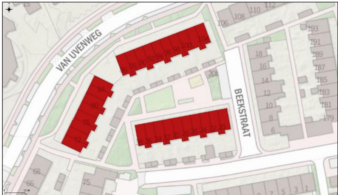
Figuur 1. Ligging en overzicht van de te renoveren woningen: Beekstraat 20-38 (even) en Van Uvenweg 70-104 (even).