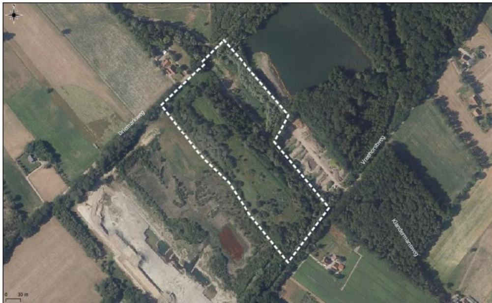
Figuur 2: Het plangebied (omlijnd met witte stippellijn).