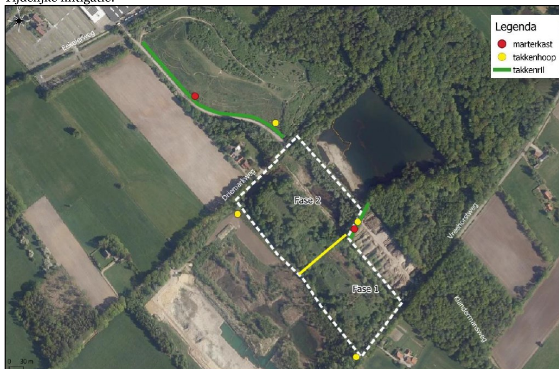
Figuur 4: De locaties van de (tijdelijke) mitigerende maatregelen. De vier gele stippen geven de locaties van de marterhopen weer. De twee rode stippen geven de marterkasten weer, welke ook bedekt worden door een marterhoop. De groene lijnen geven de takkenrillen weer. De gele lijn in het midden geeft een globale splitsing tussen de twee fases weer. Fase 1 in deze afbeelding is fase 2, fase 2 in deze afbeelding is fase 1.