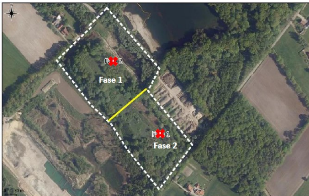
Figuur 3: De verdeling van de fasering.

De werkzaamheden zullen starten in het noordelijke deel van het gebied. Dit staat incorrect aangegeven in het saneringsplan en projectplan. De omschrijving van de werkzaamheden per fase blijft ongewijzigd.