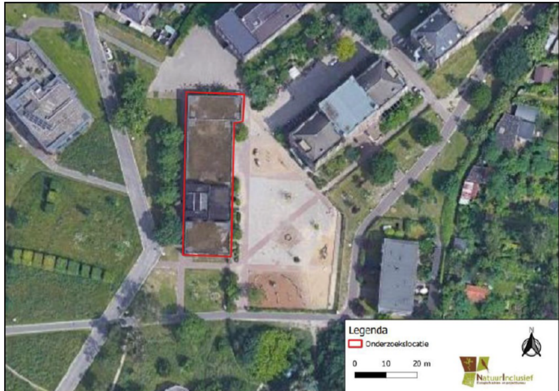
Figuur 1: Indruk van het plangebied (rood kader).