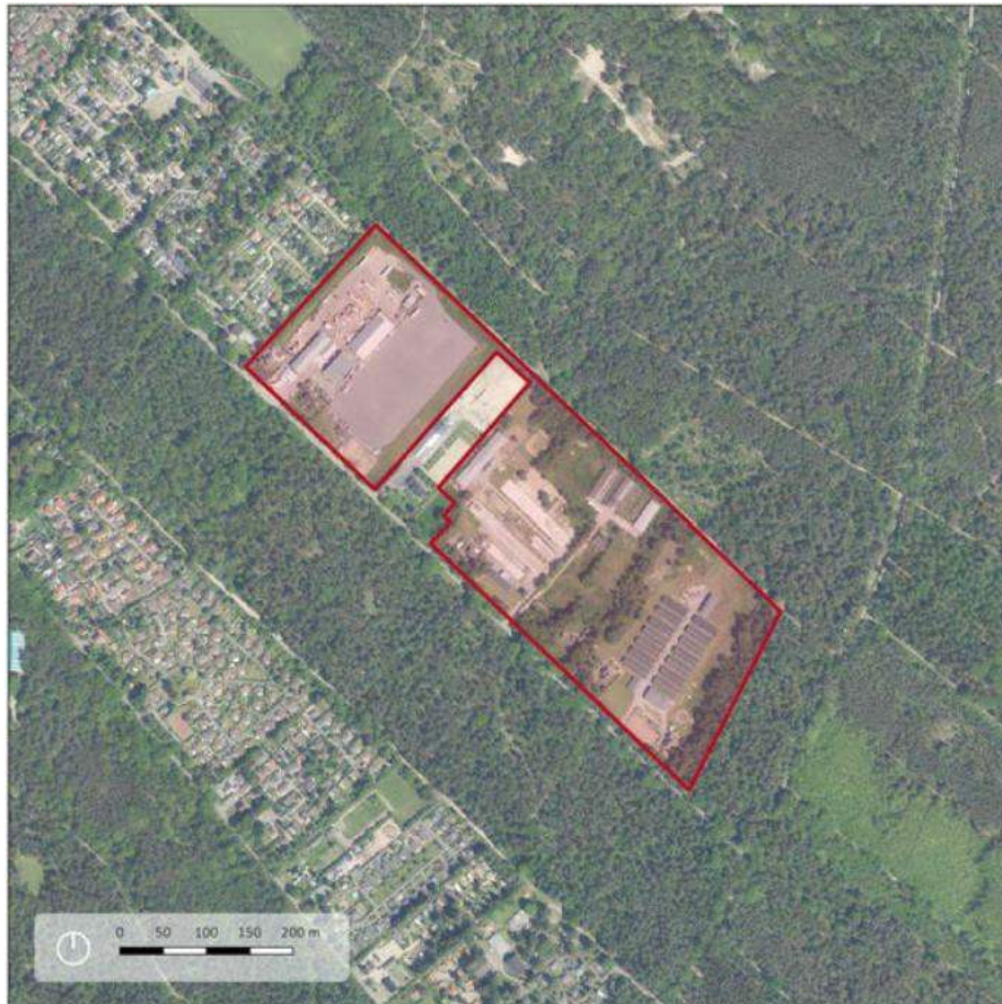
Figuur 2. Luchtfoto projectgebied.