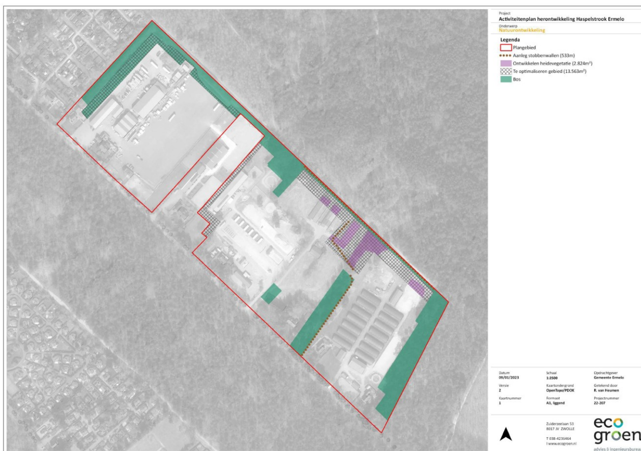
Figuur 1. Mitigerende maatregelen.