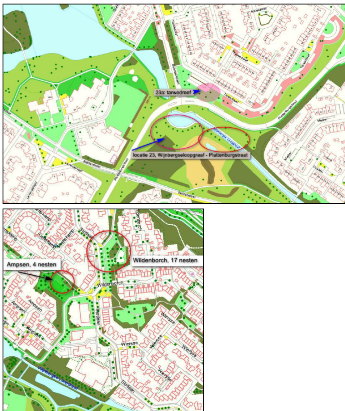
Figuur 2. Een overzicht van de locaties waar in 2023/2024 nesten van roek verwijderd worden op overlastlocaties (zie vervolg in figuur 2). Boven : locatie Tarwedreef en omgeving. Hier worden 7 nesten verwijderd. Onder : locatie Ampsen en Wildenborch. Bij Ampsen worden 4 nesten verwijderd. Bij de Wildenborch gaat het om 17 te verwijderen nesten (zie ook separate ontheffing met zaaknummer 2021-009295).