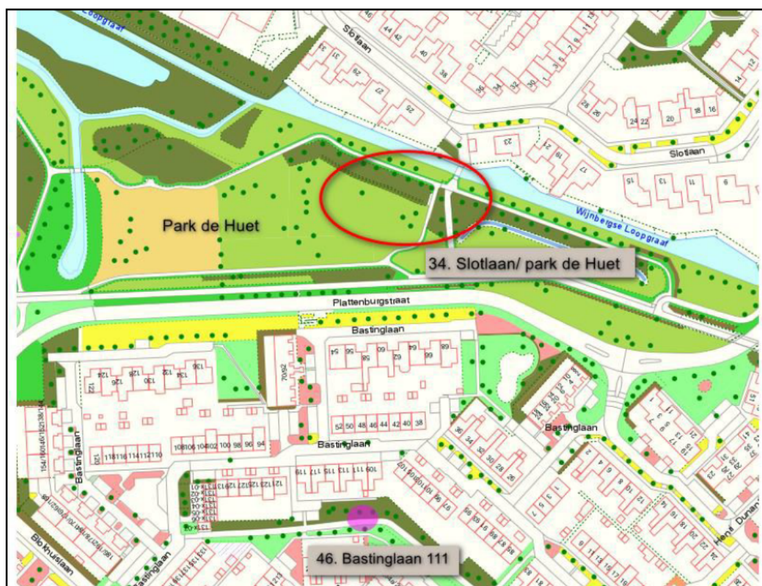
Figuur 3. Een overzicht van locatie Bastinglaan waar 2 nieuwe nesten van roek verwijderd worden (paarse cirkel), op circa 150 meter afstand van locatie de Slotlaan (rode cirkel).