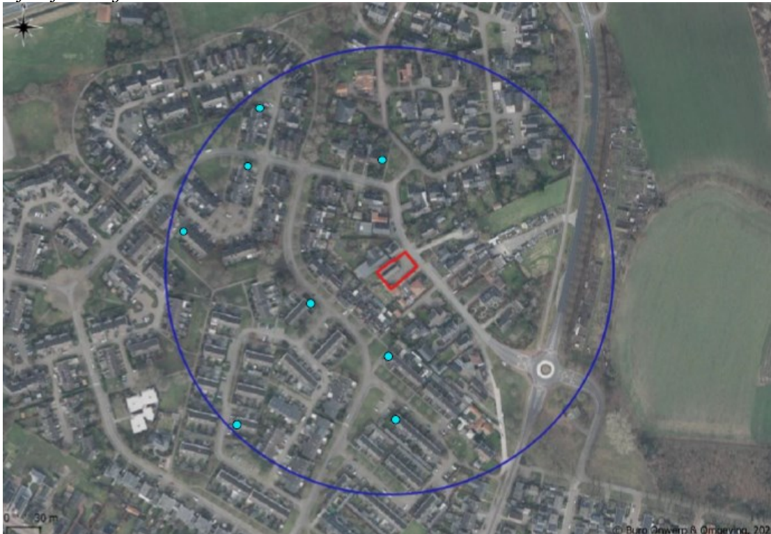
Figuur 3: Locaties van de acht tijdelijke vleermuizenkasten (type VK WS 02 of VK WS 11 van Vivara Pro of gelijkwaardige vleermuizenkasten; lichtblauwe stippen) ten opzichte van het projectgebied (rood kader). De donkerblauwe cirkel geeft de straal van 200 meter vanaf het projectgebied weer.

In de nieuwbouw (twee twee-onder-één-kap woningen) wordt ruimte voor permanente verblijfplaatsen gerealiseerd. De nieuwe bebouwing wordt voorzien van in totaal vier spouwruimtes van meer dan 2 centimeter breed. Ter grip en tegen verstrengeling in los materiaal worden de binnenzijden van de spouwruimte bekleed met kunststofgaas met een maximale maaswijdte van 1 tot 2 mm. In totaal zullen er vier spouwruimtes van minimaal 3 cm breed gerealiseerd worden, twee van 2 bij 1 meter in de voorgevels en twee van 2 bij 2 meter in de zijgevels van de nieuwbouw. De spouwruimtes zullen op de hoek van de voorgevel en zijgevel met elkaar verbonden zijn. Elke spouwruimte zal op minimaal 2 plaatsen toegankelijk gemaakt worden voor de gewone dwergvleermuis, in de vorm van open stootvoegen van 1,5 tot 2 centimeter breed op minimaal 3 meter hoogte. Hierdoor zullen in totaal 8 openingen aanwezig zijn.