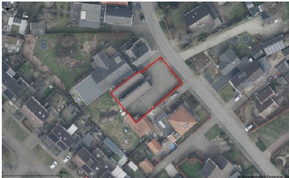
Figuur 2: Omkadering van het projectgebied (rood kader).