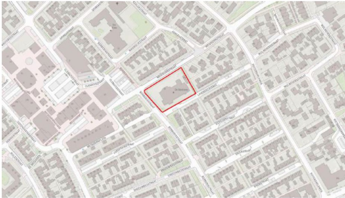
Figuur 1. Ligging en begrenzing plangebied Meidoornstraat 20 te Wezep.