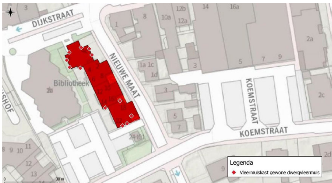
Figuur 4: Overzicht locaties permanente mitigerende maatregelen (rode ruiten) binnen het plangebied (rood gemarkeerde bebouwing).