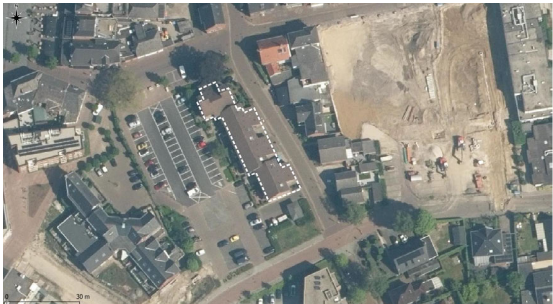
Figuur 2: Luchtfoto ligging plangebied. Het plangebied is wit omlijnd. Afbeelding: Econsultancy 2022.