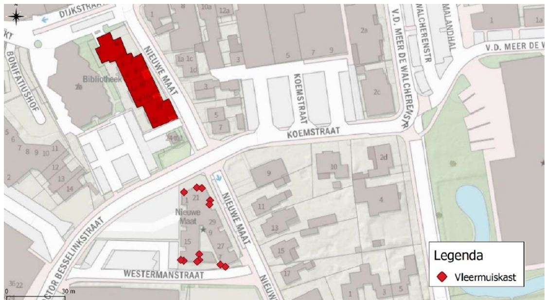
Figuur 3: Overzicht locaties tijdelijke mitigerende maatregelen (rode ruiten) ten opzichte van het plangebied (rood gemarkeerde bebouwing).