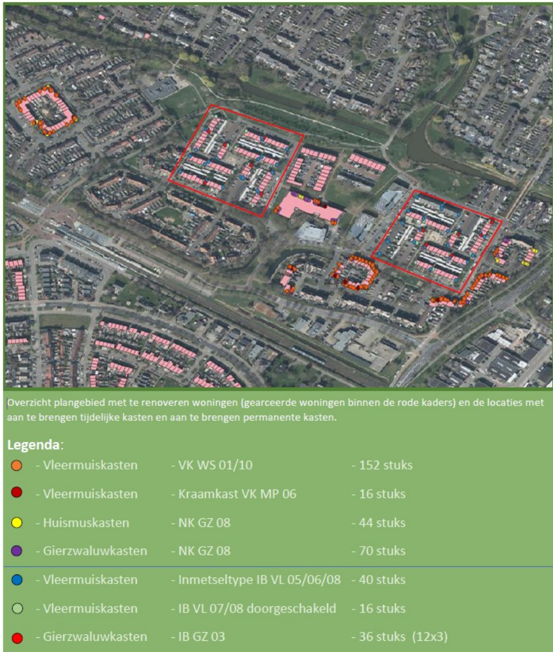
Figuur 1. Mitigerende maatregelen.