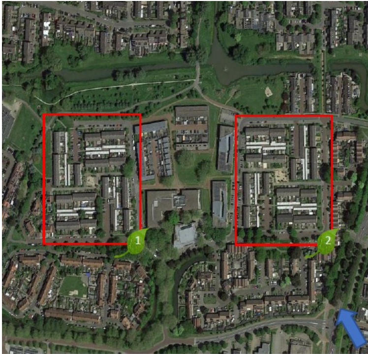
Figuur 2. Luchtfoto projectgebied.