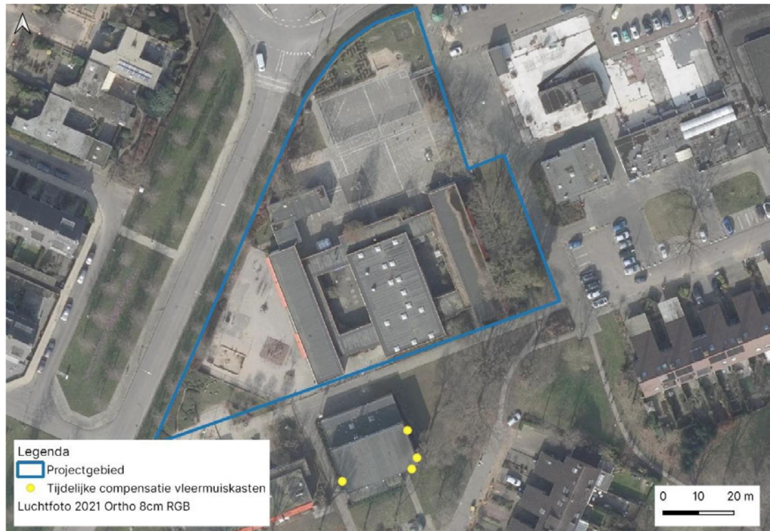
Figuur 2 Tijdelijke compensatie (gele stippen) voor vleermuizen aan het ten zuiden van het projectgebied gelegen pand aan de Weezenhof 3003 te Nijmegen.