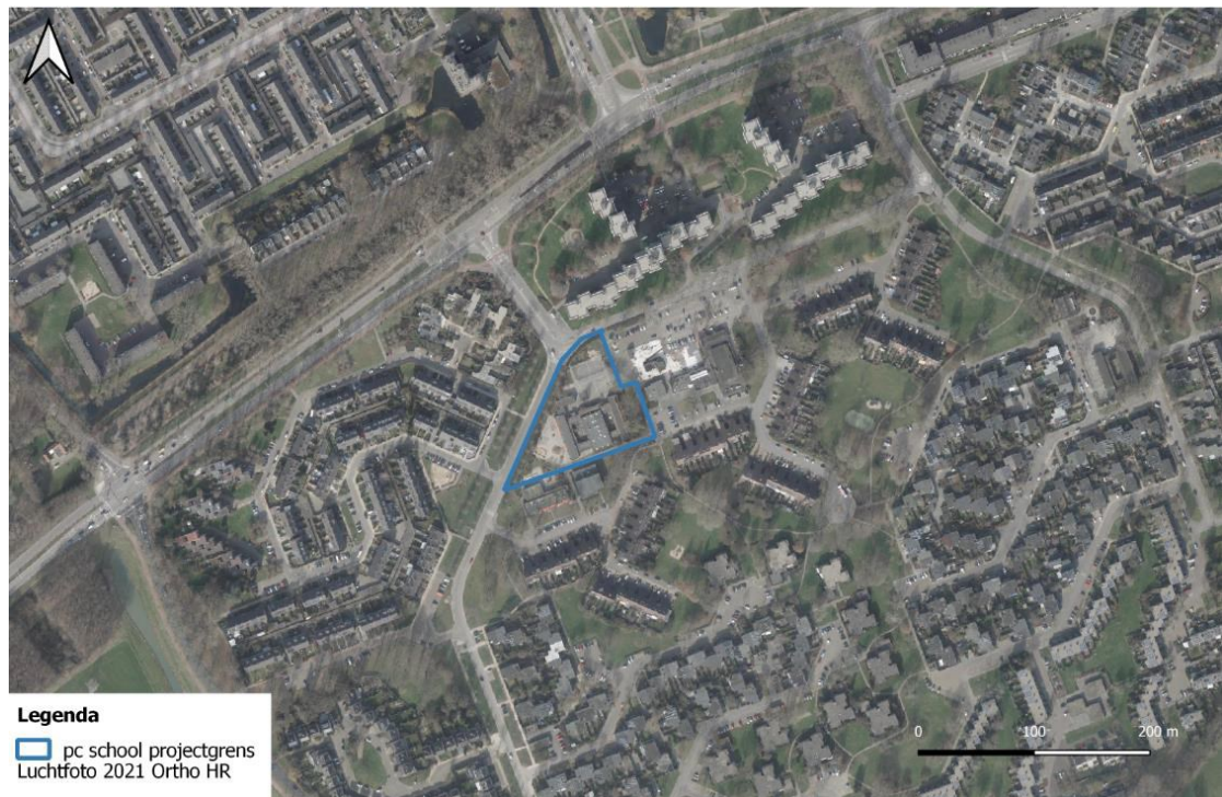
Figuur 1 Projectlocatie en onderzoeksgebied aan de Weezenhof 4002 te Nijmegen.