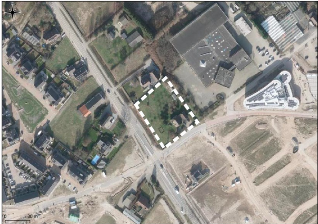
Figuur 1 Luchtfoto van het projectgebied (wit gestreept kader) aan de Griftdijk Noord 20 te Lent en directe omgeving.