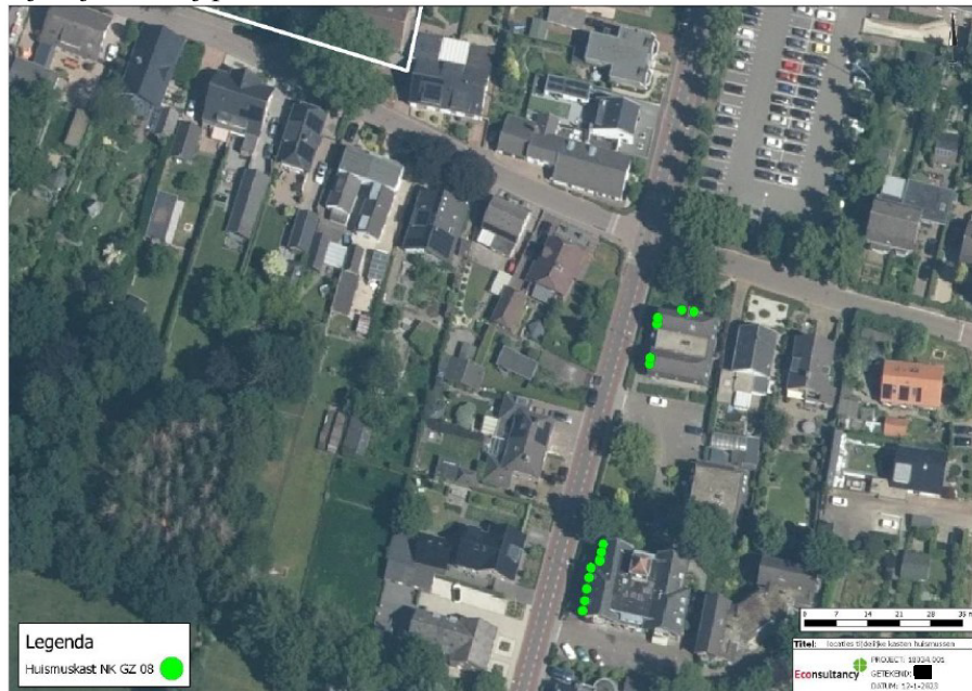
Figuur 3: De locaties voor de tijdelijke nestkasten voor de huismus (groene stippen).