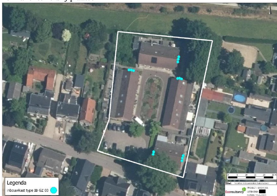
Figuur 4: Locaties van de inbouwkasten voor de huismus (blauwe stippen).