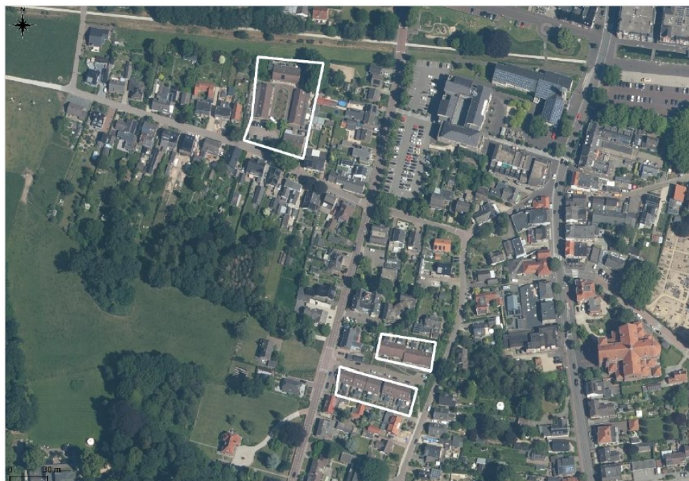
Figuur 2: De projectlocaties (wit omkaderd).