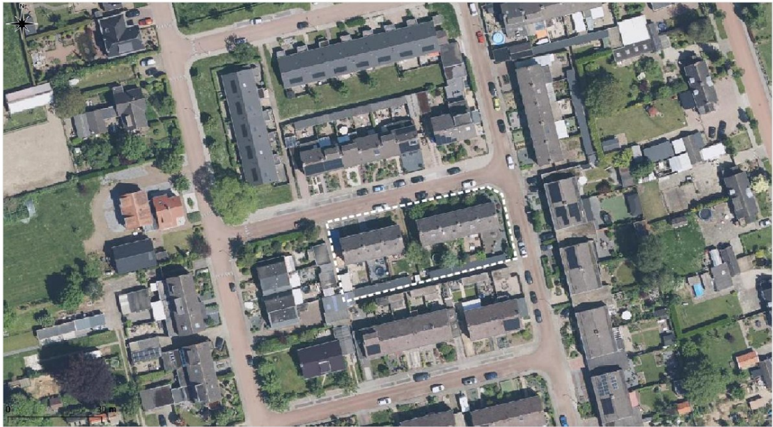
Figuur 1. Ligging en begrenzing projectgebied aan de Mauritsstraat 4 t/m 16 (even nummers) te Andelst (witte stippellijn).