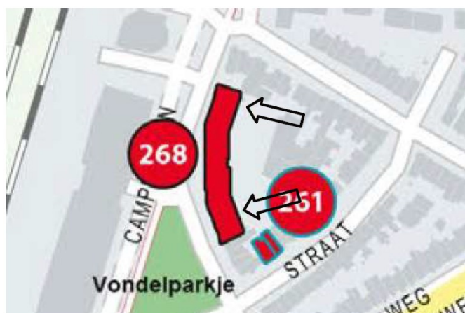
Figuur 5. Locaties van de tijdelijke voorzieningen voor gewone dwergvleermuis aan de achterzijde van complex 268 (Arend Noorduijnstraat en Van Diemerbroeckstraat) ten noorden van complex 261.