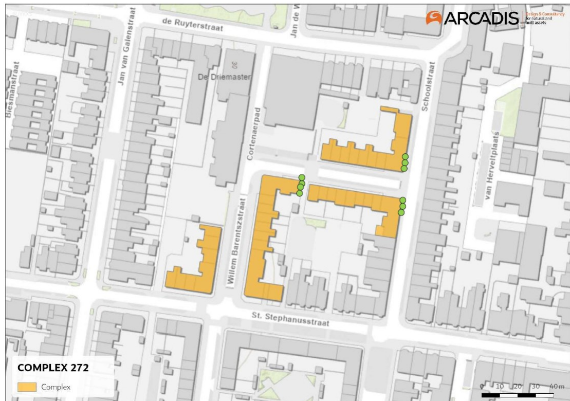
Figuur 3. Locaties van de tijdelijke gierwaluwnesten aan de Willem Barentszstraat en Schoolstraat (complex 272) ten zuiden van complex 260.