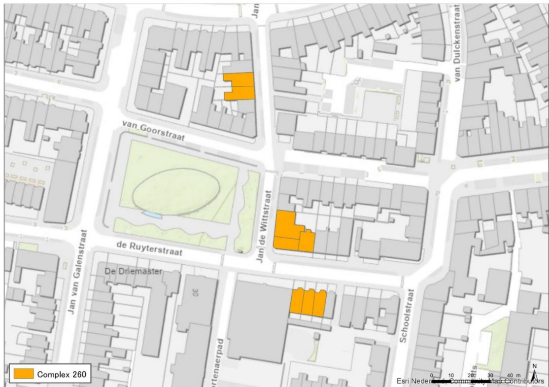
Figuur 1. Complex 260 ten zuiden van het centrum van Nijmegen: Jan de Wittstraat 62 t/m 68 (bovenste vlak), Jan de Wittstraat 75 t/m 81 en Ruyterstraat 38 t/m 44 (middelste vlak), Ruyterstraat 41 t/m 51 (onderste vlak).