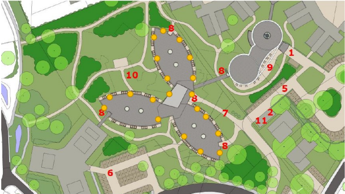
Figuur 3 Locaties van de 20 permanente verblijfplaatsen (oranje stippen) in de nieuwbouw binnen het projectgebied aan De Egge 63 Varsseveld. De rode cijfers zijn niet van belang in deze context.