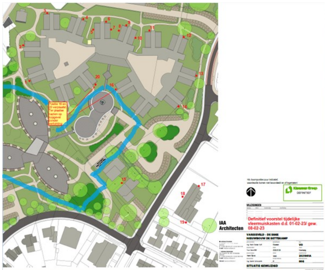
Figuur 2 Locaties waar de 20 tijdelijke vleermuiskasten zijn opgehangen (rode stippen) nabij het projectgebied (blauwe lijn) aan De Egge 63 Varsseveld.