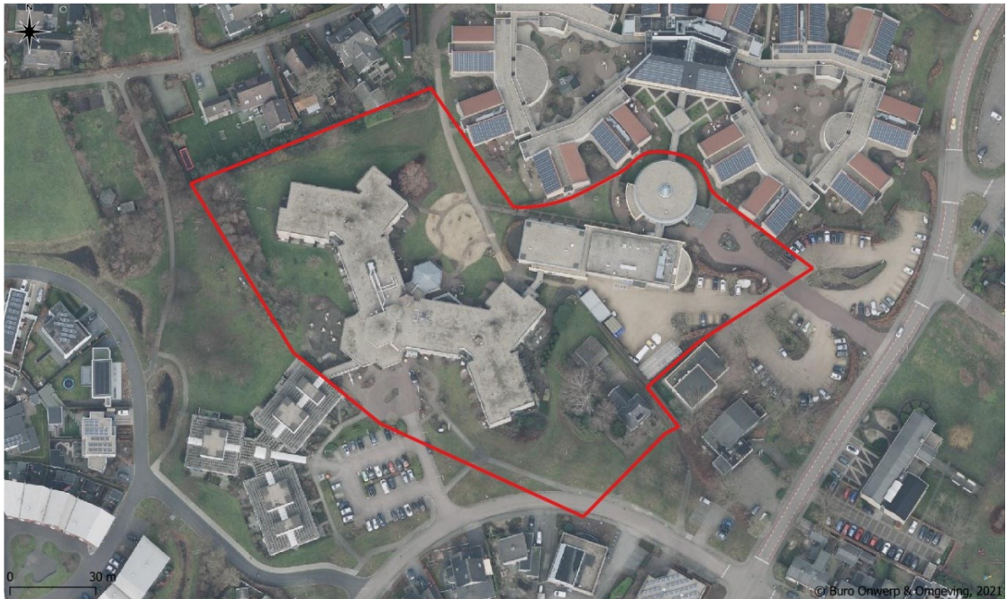
Figuur 1 Luchtfoto van het projectgebied woonzorgcentrum De Bettekamp aan de Egge 63 Varsseveld (rood kader).