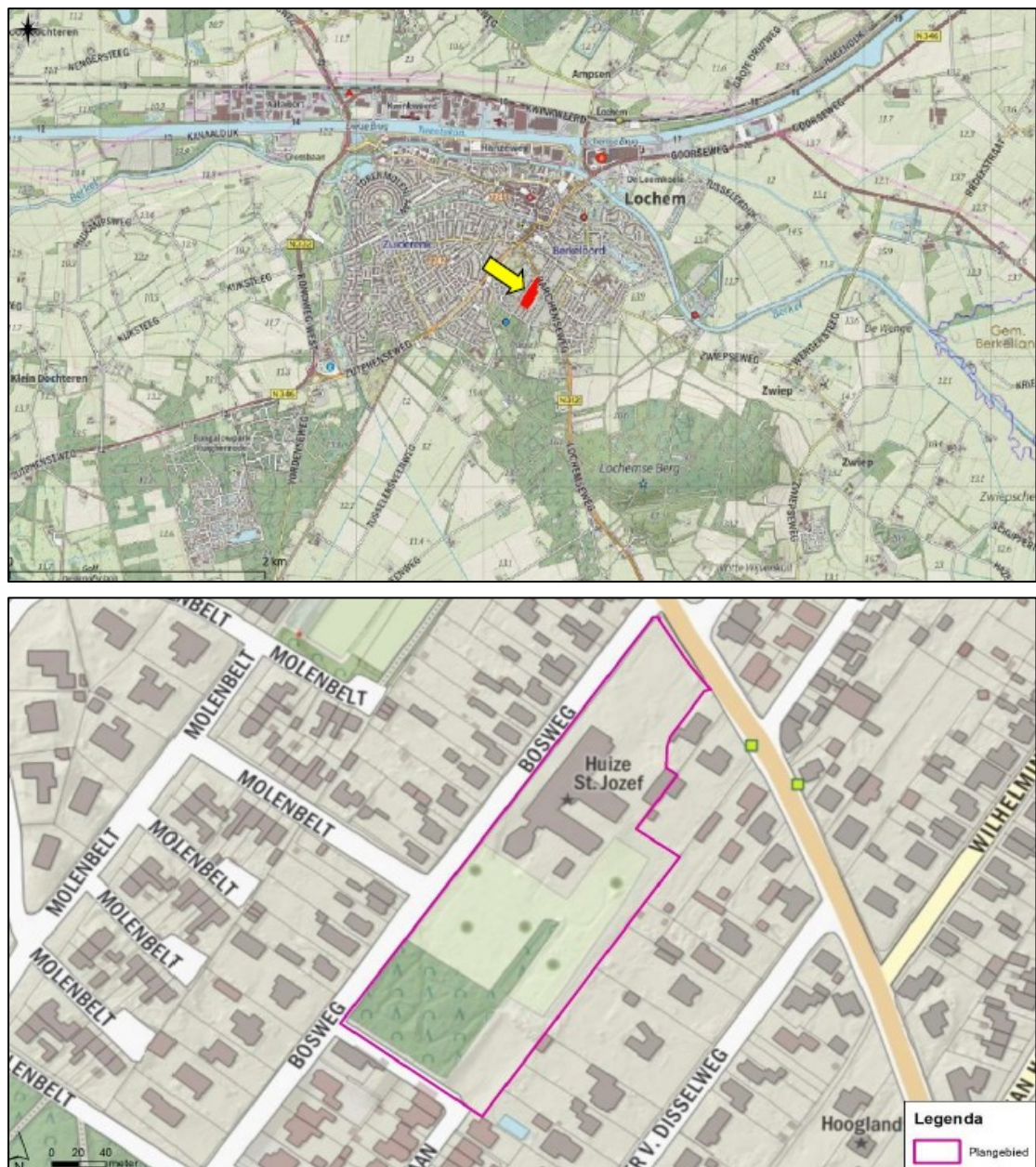
Figuur 1. De ligging en begrenzing van het plangebied aan de Bosweg 1 te Lochem (met een gele pijl en roze omlijnd weergegeven).