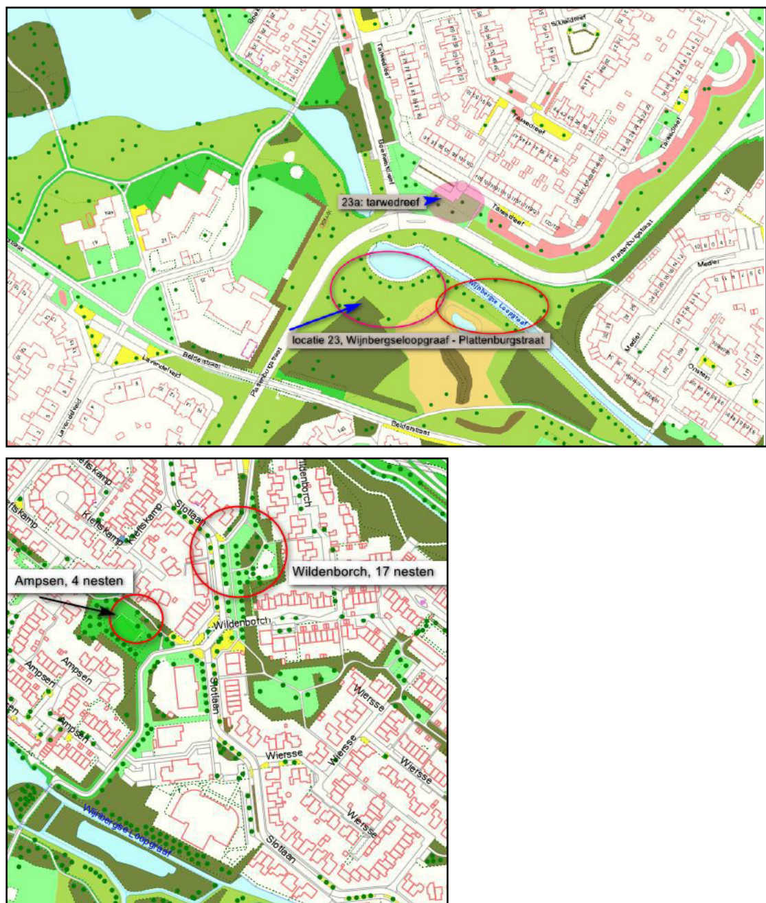
Figuur 2. Een overzicht van de locaties waar in 2023/2024 nesten van roek verwijderd worden op overlastlocaties (zie vervolg in figuur 2). Boven: locatie Tarwedreef en omgeving. Hier worden 7 nesten verwijderd. Onder: locatie Ampsen en Wildenborch. Bij Ampsen worden 4 nesten verwijderd. Bij de Wildenborch gaat het om 17 te verwijderen nesten (zie ook separate ontheffing met zaaknummer 2021-009295).