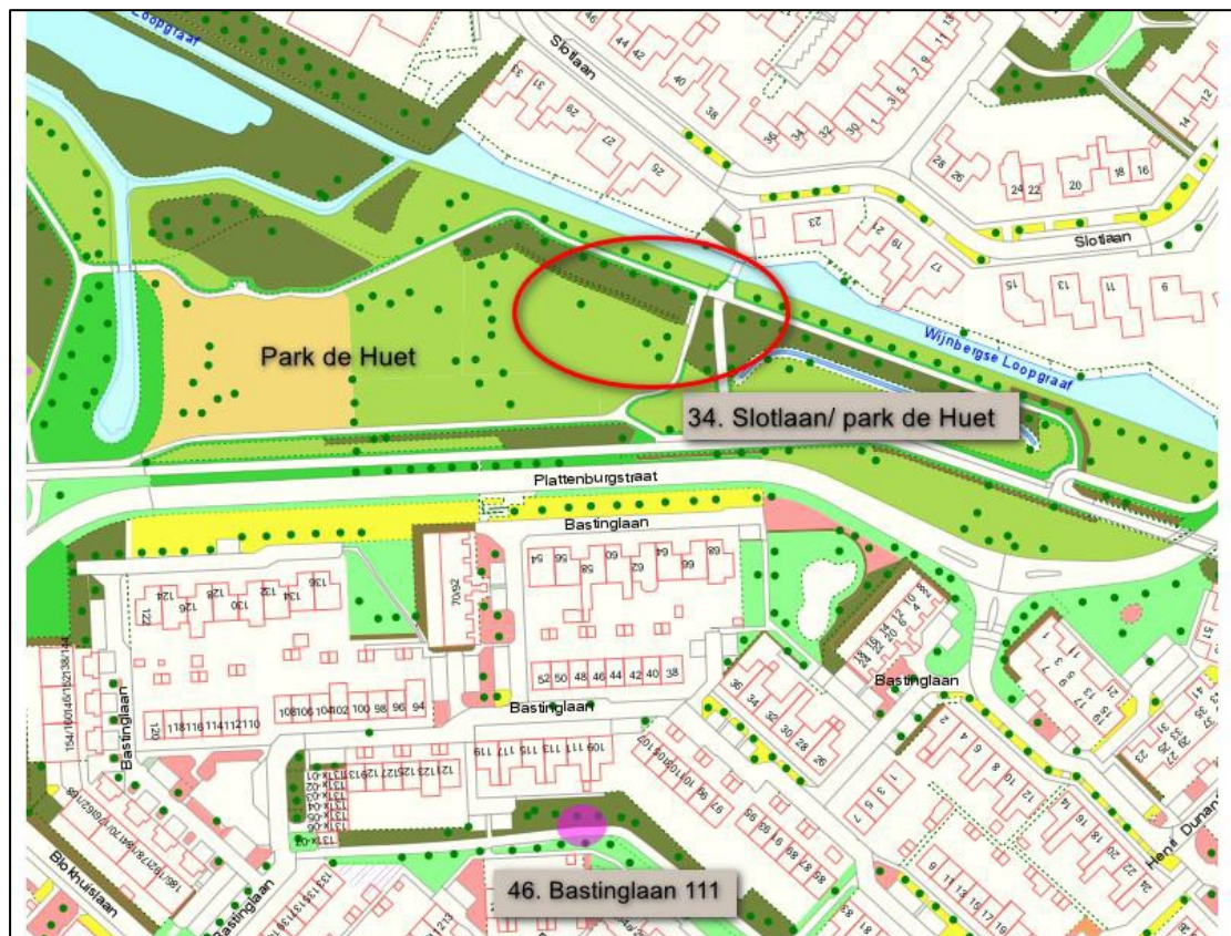
Figuur 3. Een overzicht van locatie Bastinglaan waar 2 nieuwe nesten van roek verwijderd worden (paarse cirkel), op circa 150 meter afstand van locatie de Slotlaan (rode cirkel).