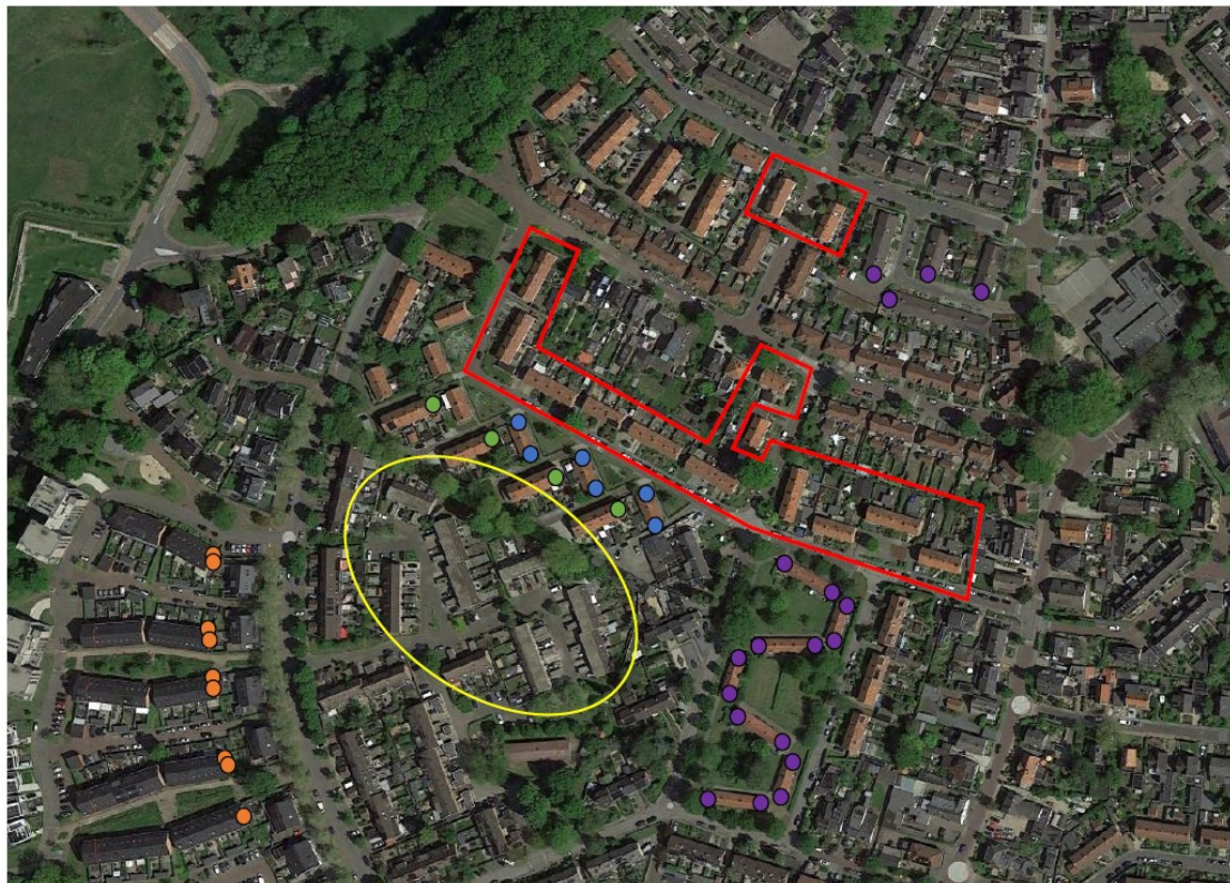
Figuur 2: Locaties van aan te brengen tijdelijke mitigerende maatregelen