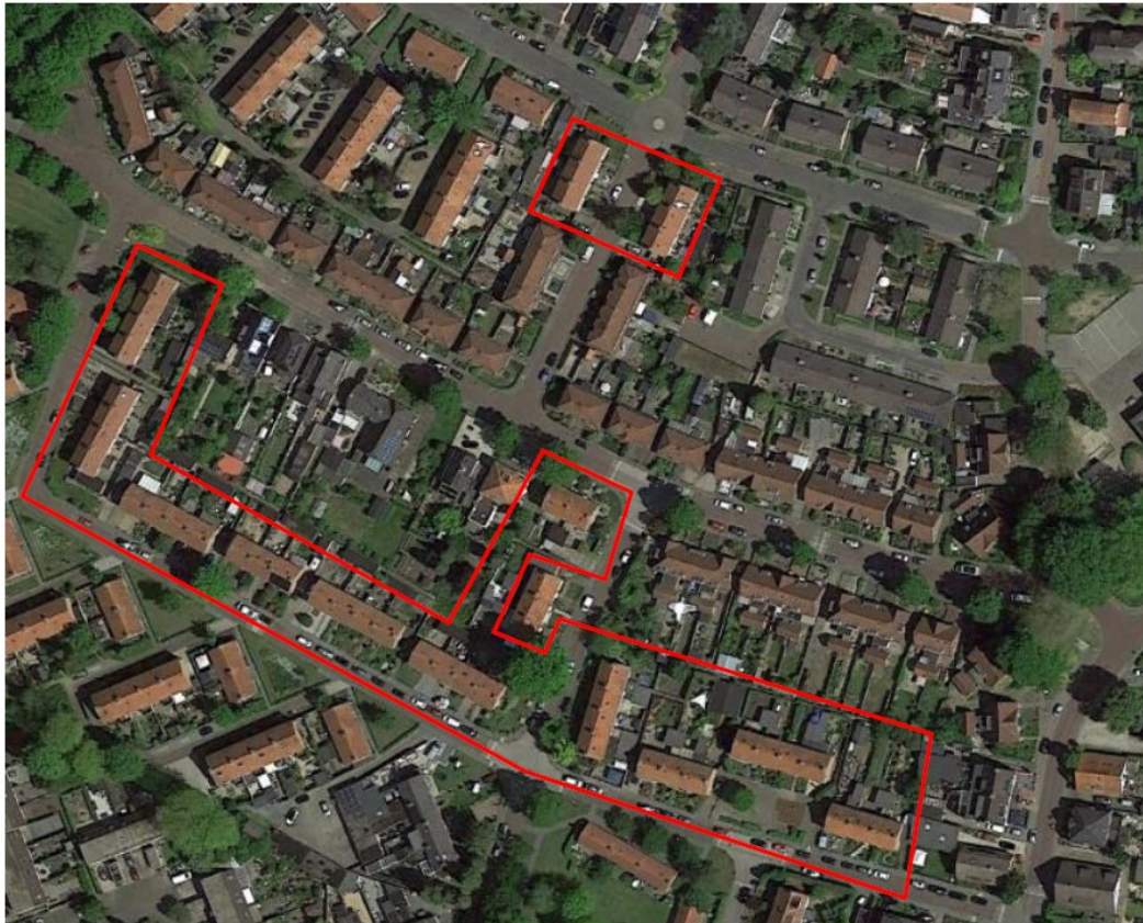
Figuur 1: Plangebied (rood omrand)