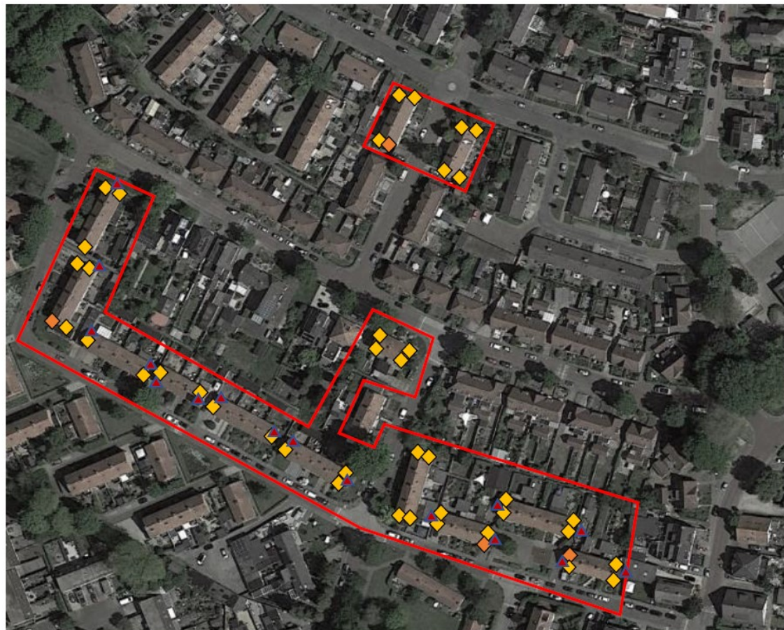
Figuur 3: Overzicht van te realiseren permanente mitigerende maatregelen