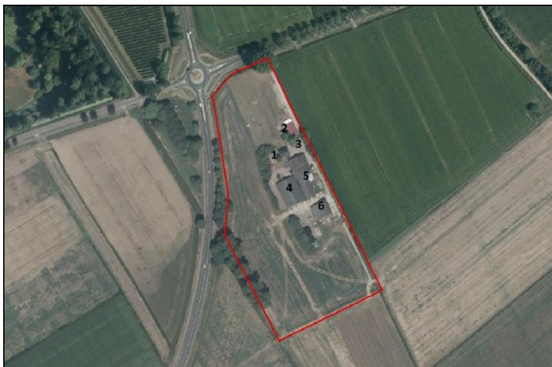
Figuur 1. De ligging en begrenzing van het plangebied aan de Heukelumseweg 5 te Asperen. 1 = woonhuis van de boerderij; 2 = houten woonhuis; 3 = treurwilg; 4 & 5 = stallen en 6 = kapschuur. De initiatiefnemer is voornemens om de stallen en kapschuur te slopen (nummers 4, 5 en 6) en binnen het plangebied twee nieuwe woningen te realiseren. Het gehele plangebied is rood omlijnd weergegeven.