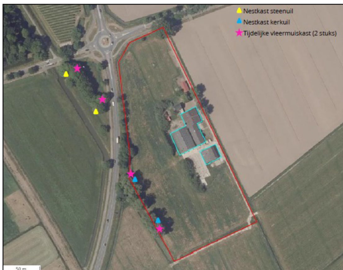
Figuur 2. De locaties van de alternatieve voorzieningen voor steenuil (gele driehoeken, permanent), kerkuil (blauwe driehoeken, permanent) en gewone dwergvleermuis en gewone grootoorvleermuis (roze sterren, tijdelijk). Op iedere weergegeven locatie van de roze sterren hangen twee kasten.