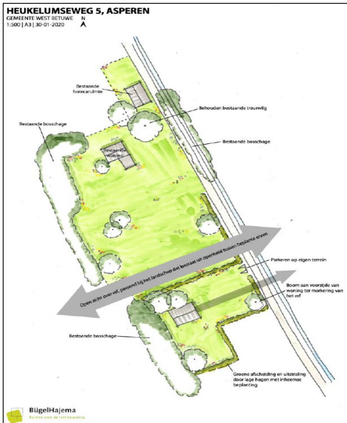
Figuur 4. Een overzicht van het agrarisch erf in de nieuwe situatie (zowel bestaande als nieuwe elementen zijn weergegeven).