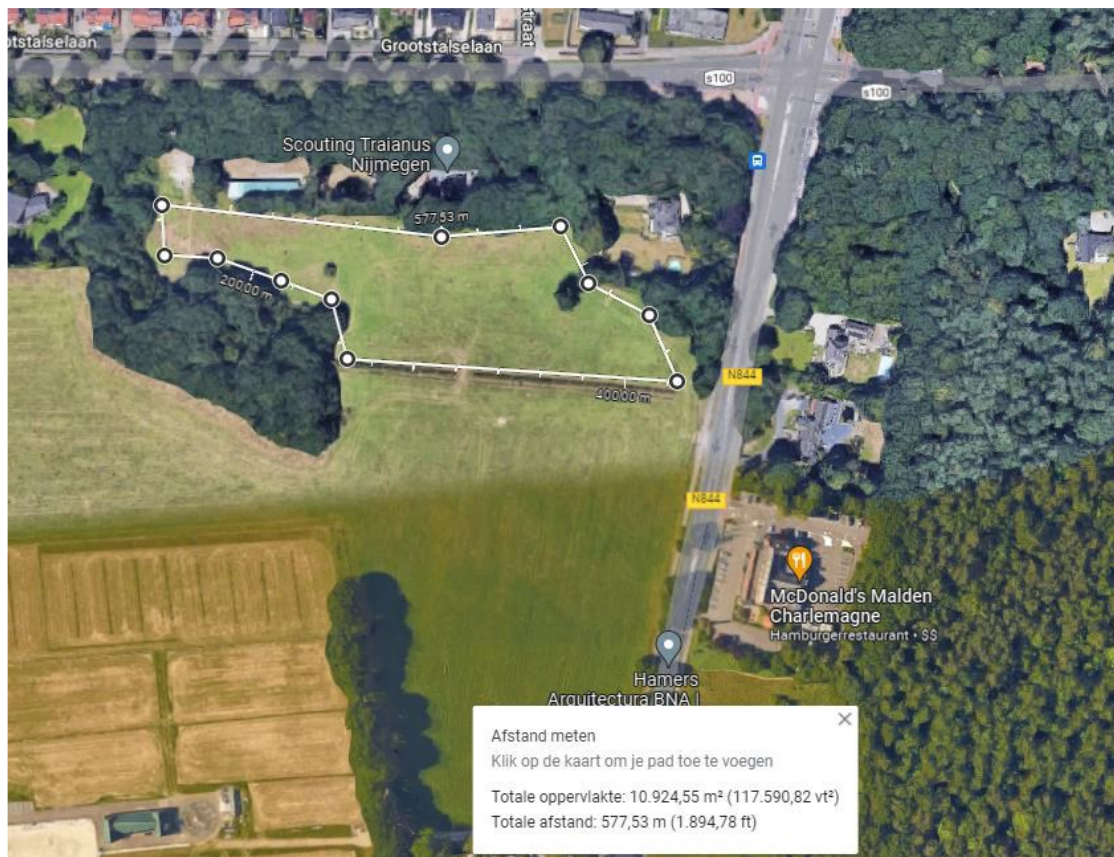
Figuur 2: ligging herplantlocatie nabij Scouting Traianus Nijmegen, kadastraal perceel: Heumen, sectie A, nummer 1080.