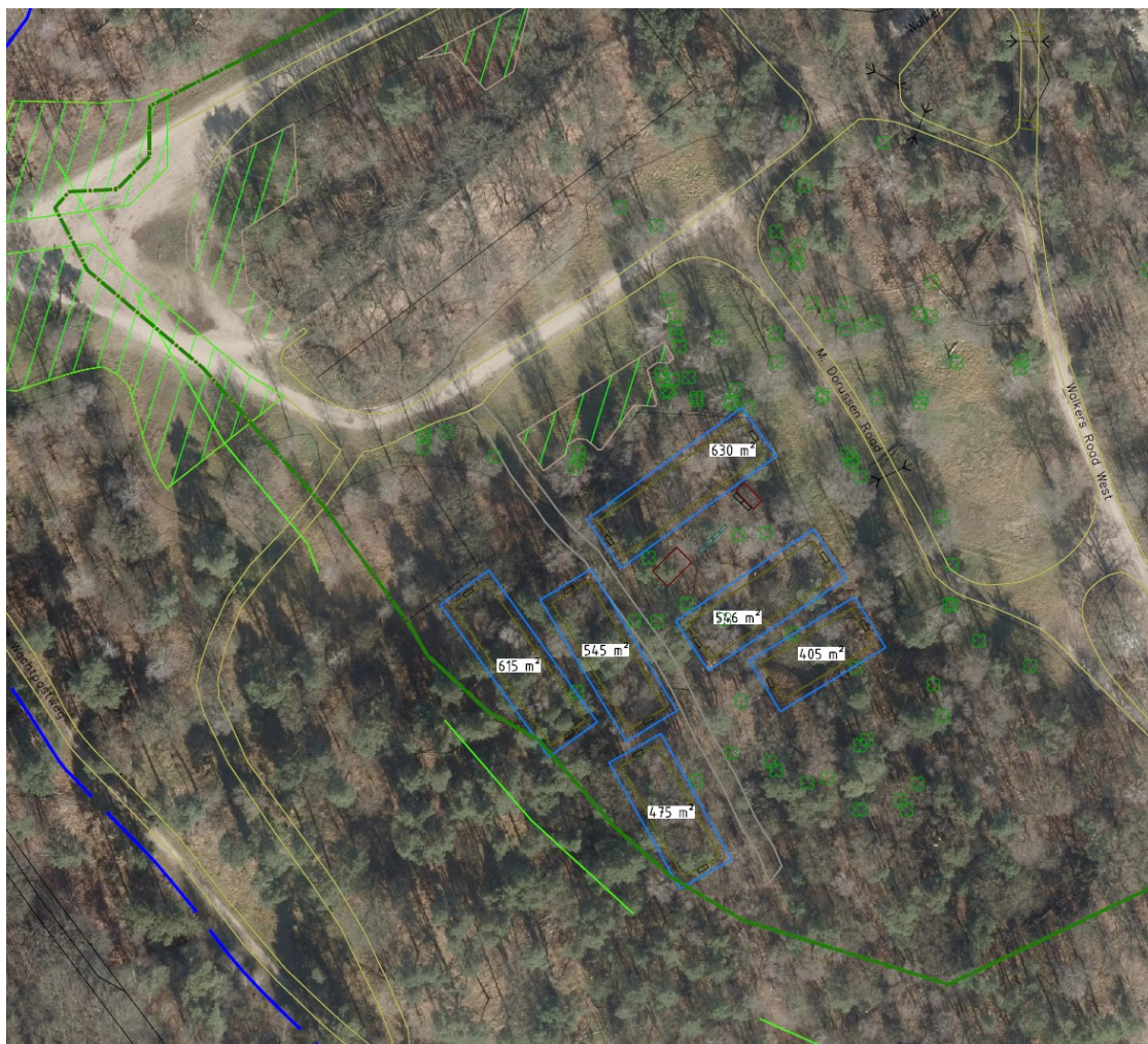
Figuur 1: Ligging kaplocatie, kadastraal perceel: Heumen, sectie B, nummer 577