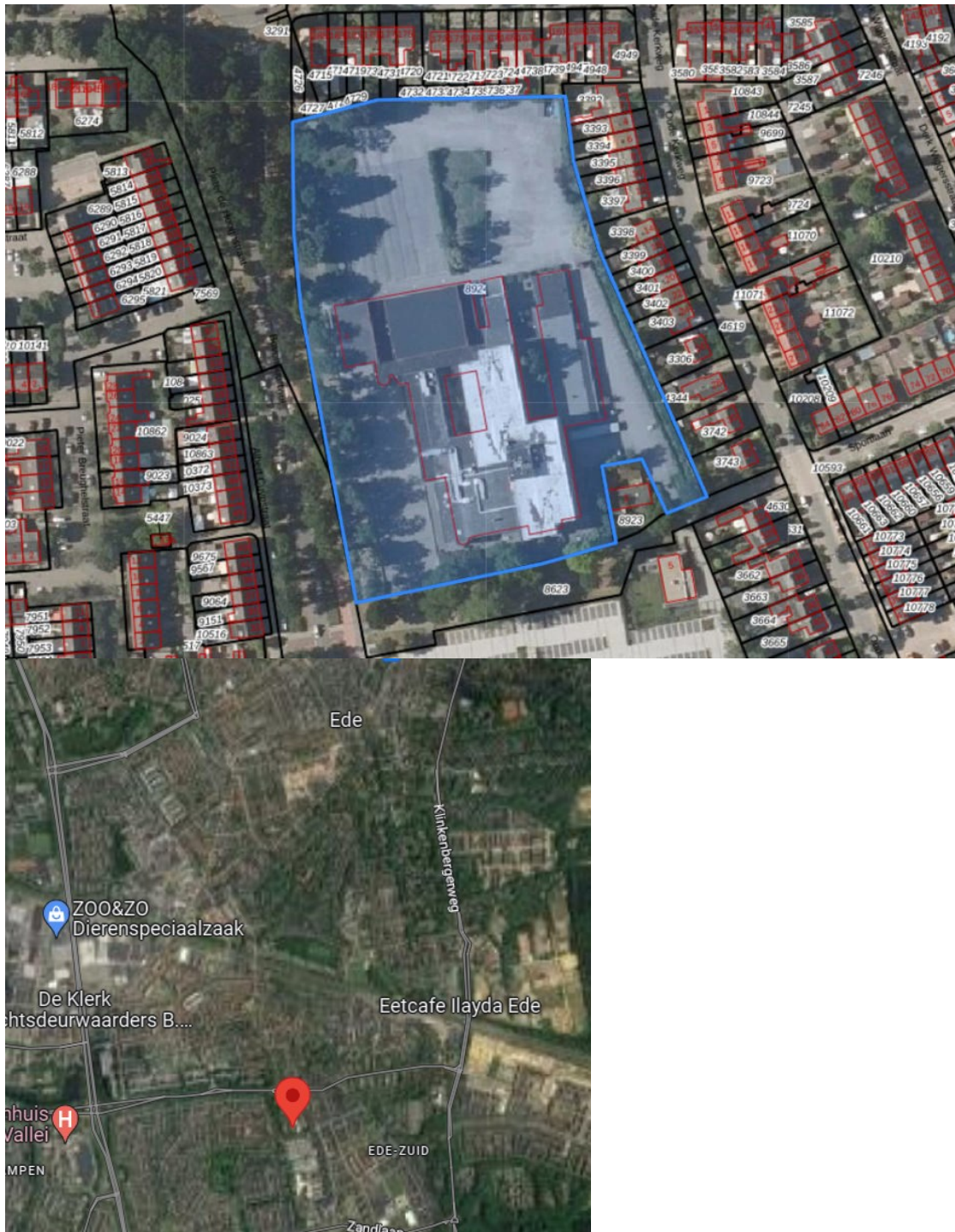
Figuur 1. Plangebied binnen blauwe kader (De Slijpkruik, 2022)