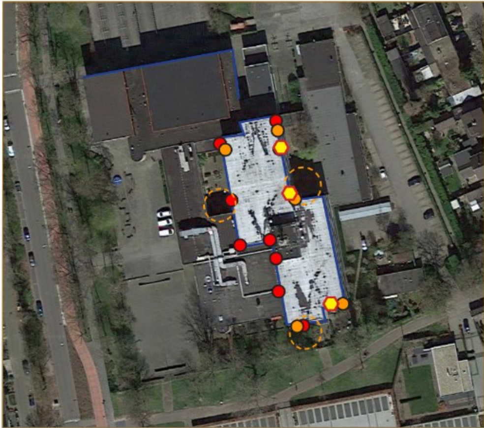
Afbeelding 1: Aanwezigheid van beschermde soorten in 2020 in het projectgebied (blauw kader), gebaseerd op het rapport 'aanvullend vleermuisonderzoek Bovenbuurtweg 1 Ede' (Tritium Advies, 2020). Bron ondergrond: GoogleEarth 2021.