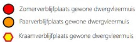
Figuur 3. Resultaten ecologisch onderzoek (De Slijpkruik, 2022).