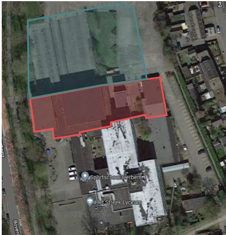
Figuur 2. Locatie nieuwbouw (blauwe vlak) en te slopen bebouwing begin april 2024 (rode vlak). De overige bebouwing wordt na 15 juli 2024 gesloopt (De Slijpkruik, 2023).