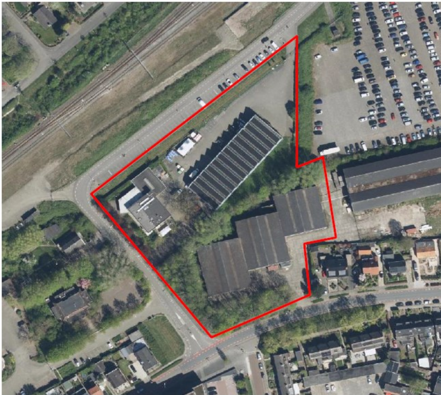
Figuur 1: Plangebied (rood omlijnd) rond de Spoorstraat 15 te Tiel.