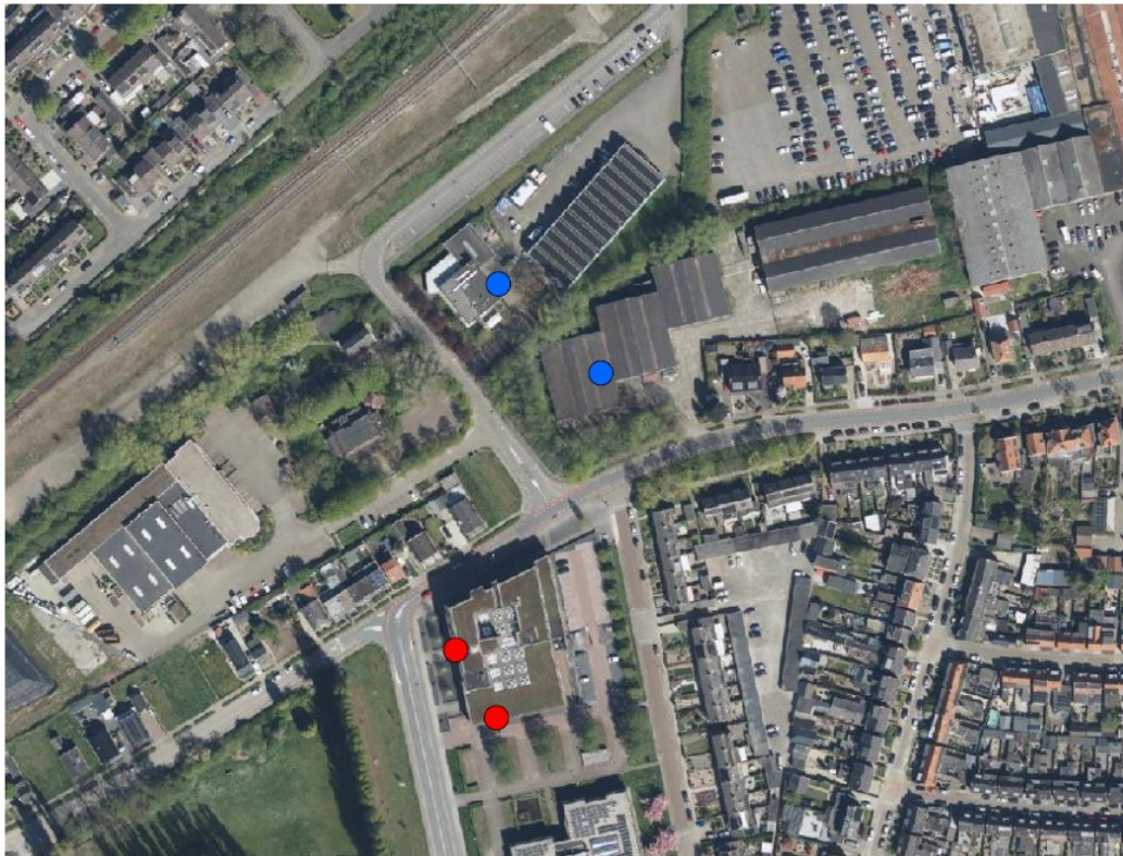
Afbeelding 2, de opgehangen vleermuiskasten (rood) ten opzichte van de aangetroffen verblijfplaatsen (blauw) (ondergrond: PDOK viewer, 2023).

Er zijn 8 tijdelijke kasten opgehangen. Bron projectplan Laneco, 2023.