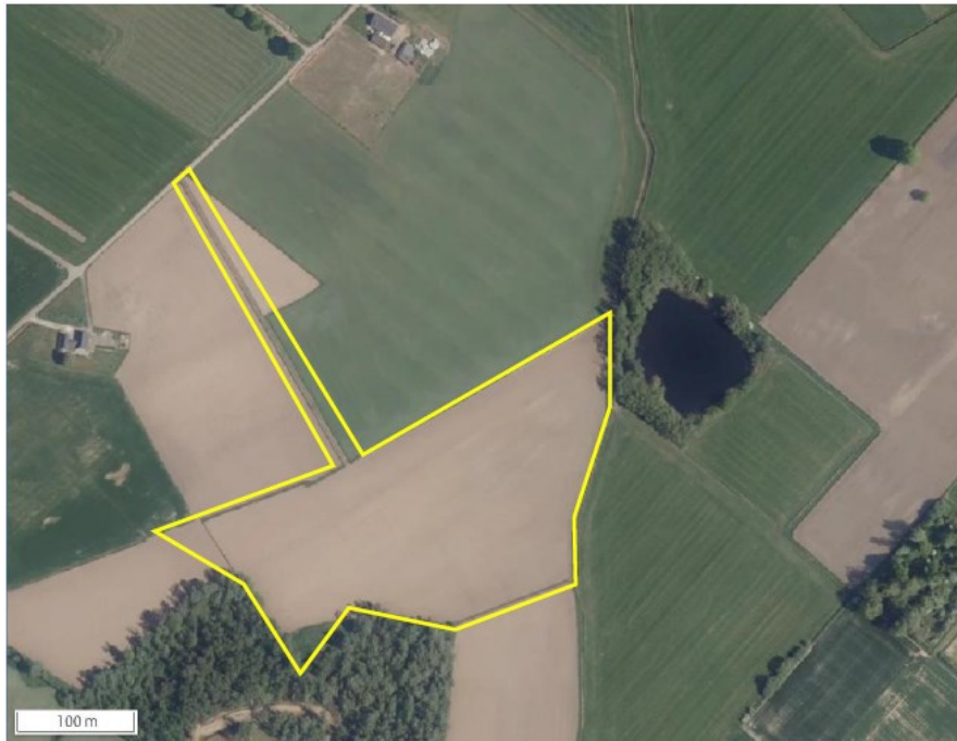
Figuur 1: Kaart van het plangebied aan de Laarstraat te Vethuizen, geel omrand