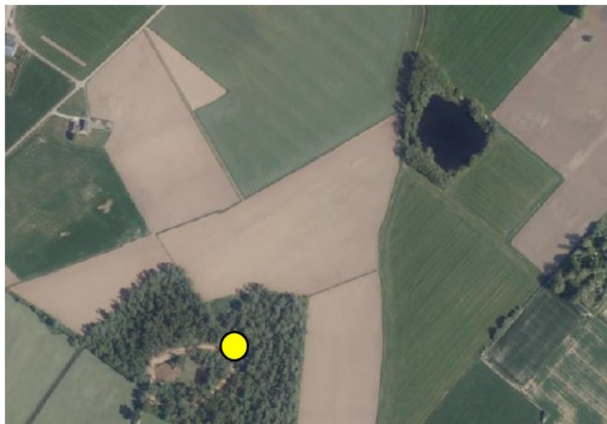
Figuur 2: Locatie van de dassenburcht, aangegeven met gele stip