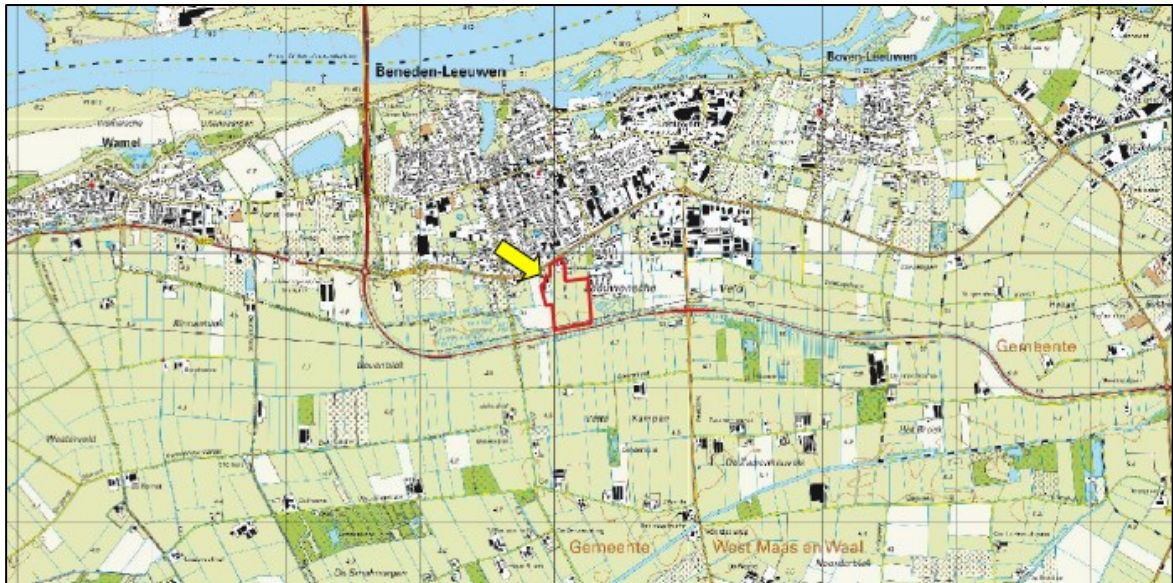
Figuur 1. Topografische ligging projectgebied.