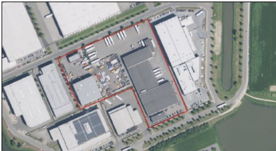
Figuur 1 Globale ligging plangebied Meelsewei 4 te Tiel