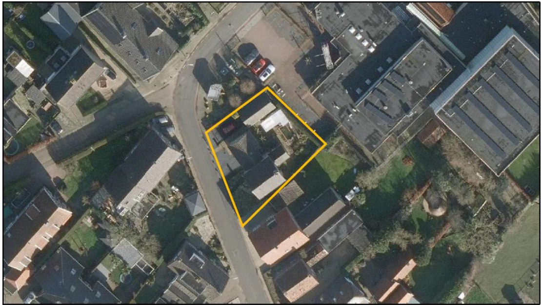
Figuur 1. Ligging en begrenzing plangebied aan de Rijdt 36 te Horssen.