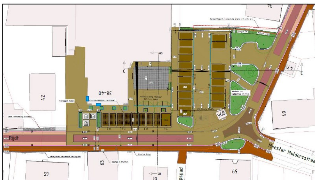
Figuur 6. Groenvoorzieningen als schuilplaats voor de huismus op het plein in de nieuwe situatie (groene vlakken) en de locaties van de permanente nestlocaties (blauwe rechthoeken). De groenvoorzieningen bestaan uit bomen die in plantvakken worden geplaatst en in het noorden komt een lange haag (grotendeels 2 meter hoog).