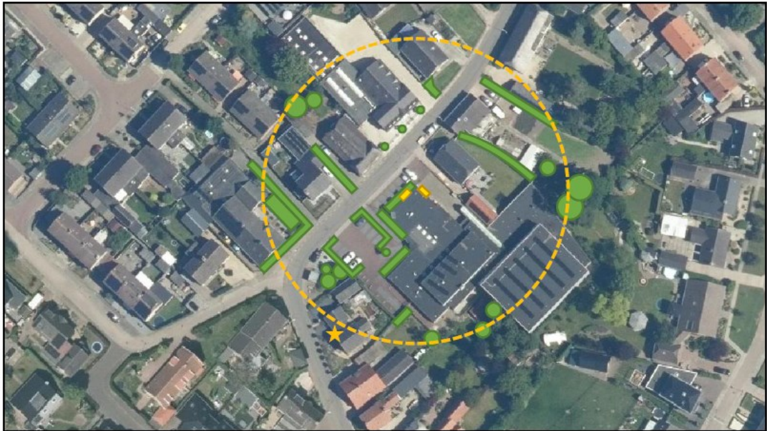
Figuur 2. Locaties van de tijdelijke huismuskasten (gele rechthoek) ten opzichte van de huidige nestlocatie (gele ster) en de groenstructuren binnen 50 meter van de tijdelijke voorzieningen.