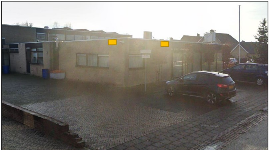
Figuur 3. Locaties van de tijdelijke voorzieningen voor huismus aan het nabijgelegen dorpshuis.