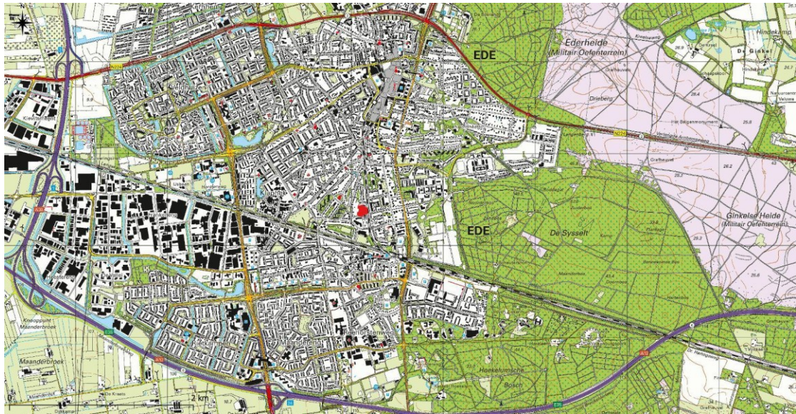
Figuur 1. Topografische ligging projectgebied (rode stip).