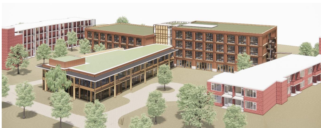
Figuur 4. Tekening toekomstige situatie.