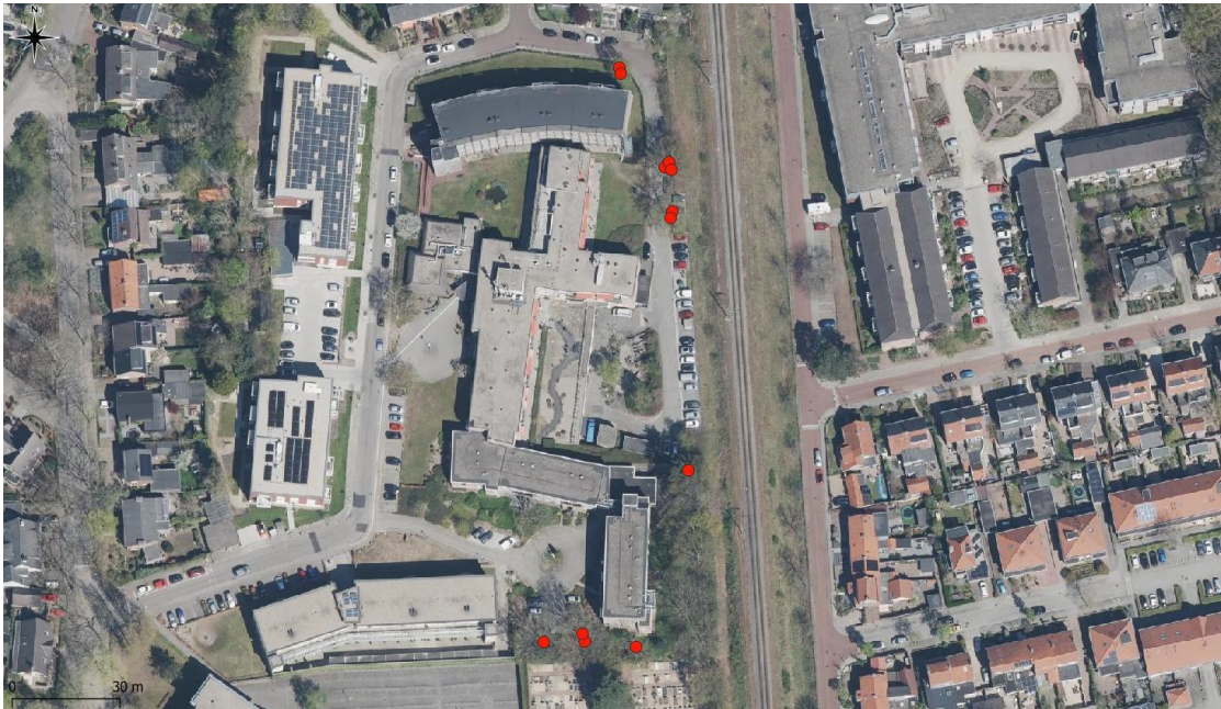
Figuur 1. Locaties tijdelijke vleermuiskasten.