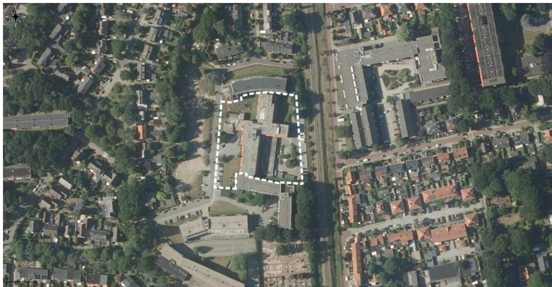
Figuur 2. Luchtfoto projectgebied (witte kader).