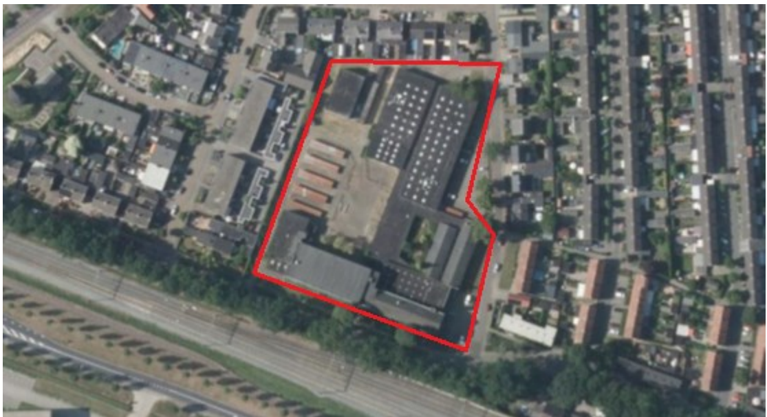
Figuur 2. Luchtfoto projectgebied.