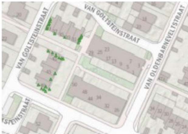
Figuur 1 Locaties waar de 27 tijdelijke nestkasten voor de huismus zijn opgehangen.