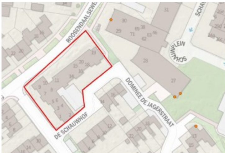
Figuur 2 Locaties waar de tijdelijke vleermuiskasten (oranje) zijn opgehangen.