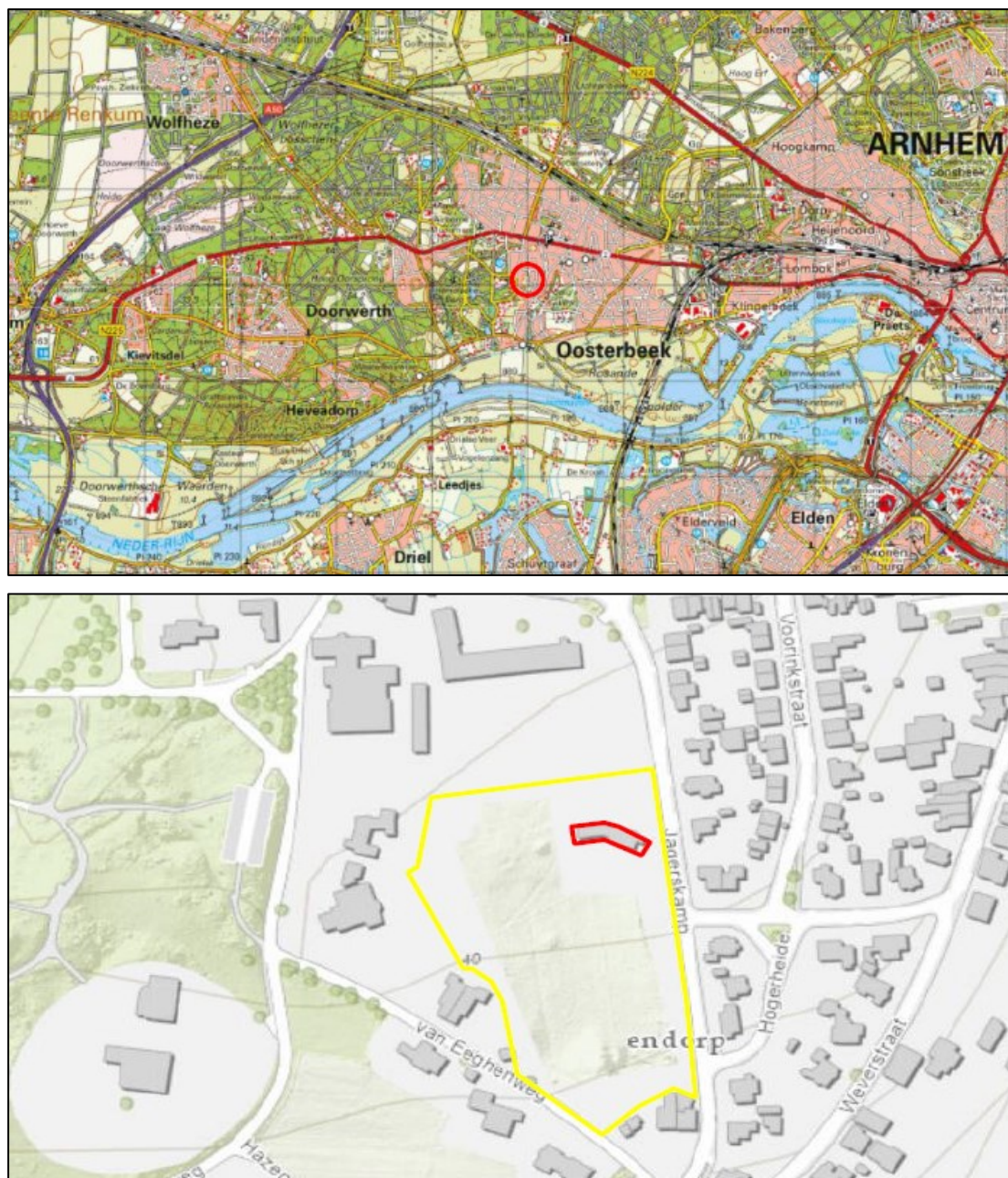
Figuur 1. De ligging en begrenzing van het plangebied aan de Jagerskamp 15 te Oosterbeek (rood omcirkeld). Op de onderste afbeelding is de te slopen woning (rood) en het kadastraal perceel (geel) weergegeven.