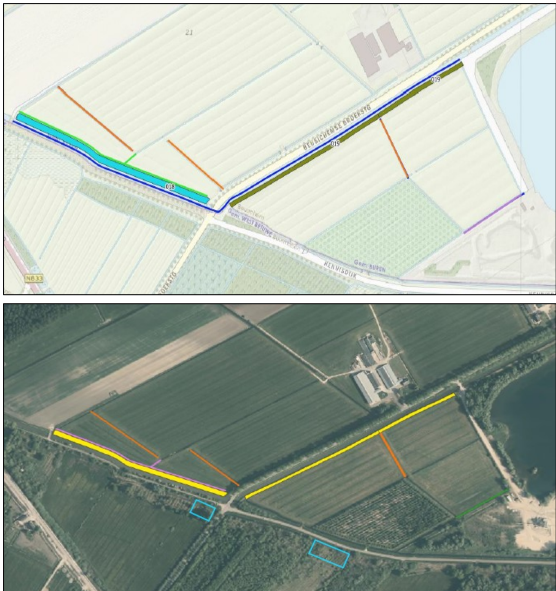
Figuur 2. Een overzicht van het projectgebied met de c-watergang (lichtgroene lijn, 379 meter lang) die in het najaar van 2022 gerealiseerd is, met name als compensatie/mitigatie voor poelkikker en heikikker (afbeelding boven). In deze watergang zijn ondiepe delen gerealiseerd om de watergang ongeschikt te maken voor vis en geschikt te maken voor poel- en heikikker. Ook is er in deze watergang een nieuwe duiker geplaatst en zijn de omstandigheden voor begroeiing nagenoeg identiek aan de te dempen watergangen. Verder: de donkerblauwe lijn weergeeft de watergang waar natuurvriendelijke oevers (819 meter) aangelegd worden. De drie oranje lijnen zijn de te dempen sloten (379 meter). De paarse lijn is de te verbreden watergang (117 meter). Op de onderste afbeelding zijn de locaties van de twee marterhopen met blauwe vierkanten weergegeven.