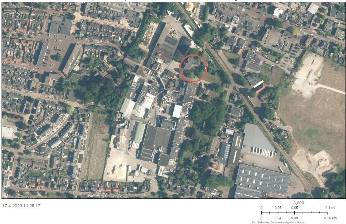
Figuur 1. Locatie inmetsselstenen huismus.