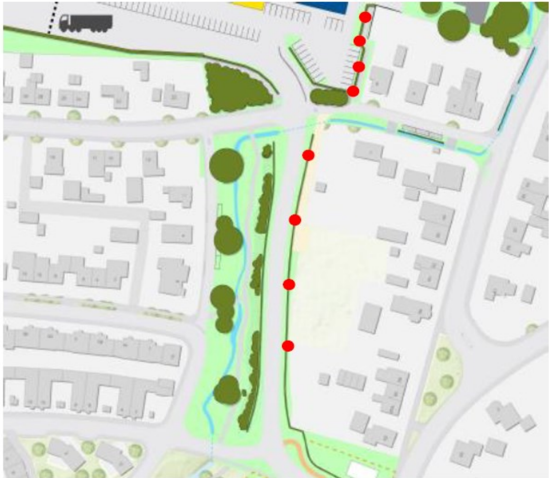
Figuur 2. Locaties opbouwkasten huismus aan de toekomstige geluidswand (als aanvulling op de inmetzelstenen).