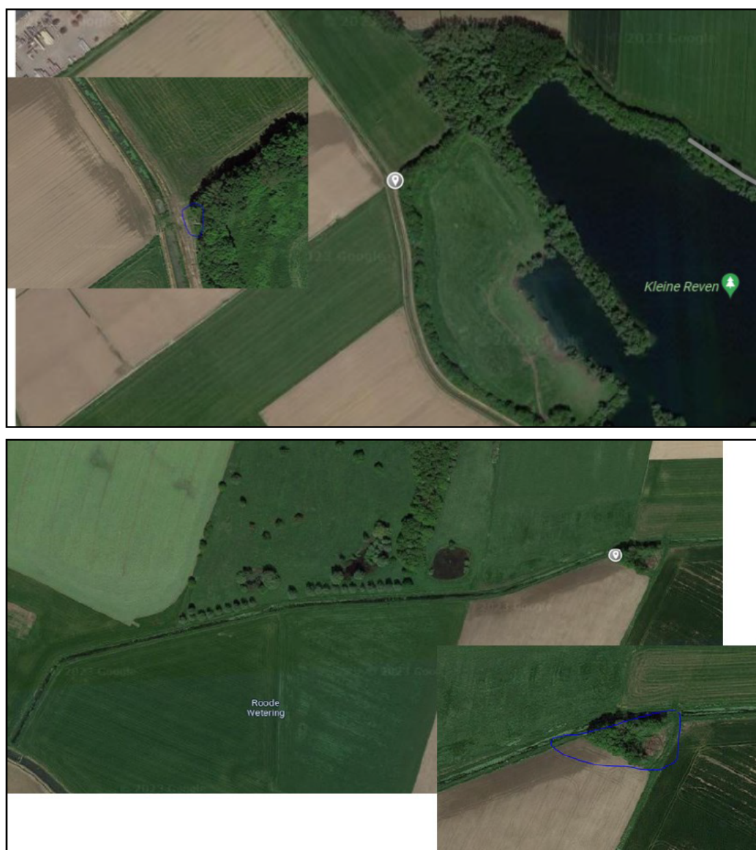
Figuur 3. De locaties van de twee te realiseren marterhopen, conform de Handreiking kleine marters van Bouwens (2017), inclusief close-up foto van de exacte locaties.